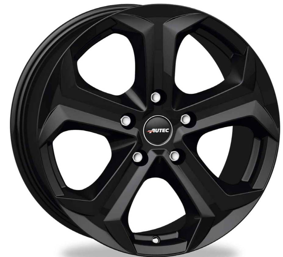
// SCHWARZ MATT