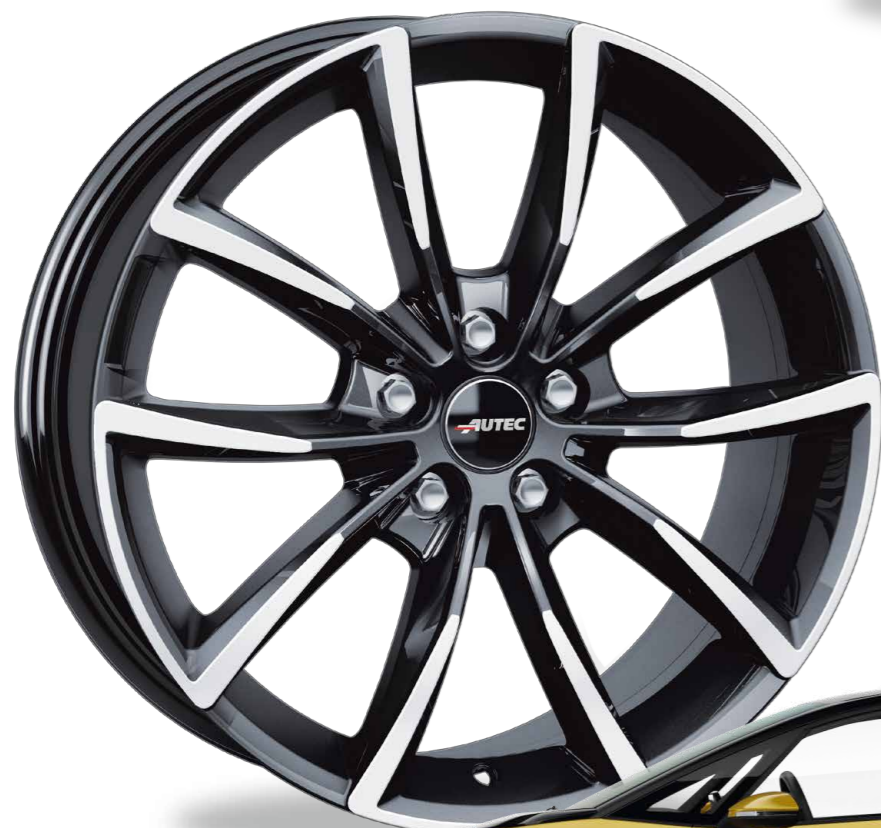
// SCHWARZ POLIERT