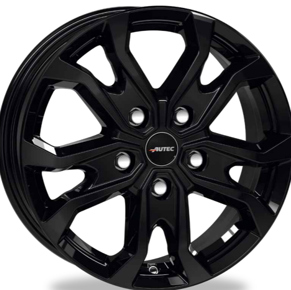
// SCHWARZ POLIERT