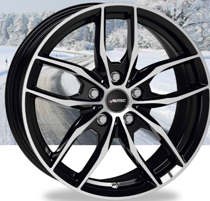
// SCHWARZ POLIERT