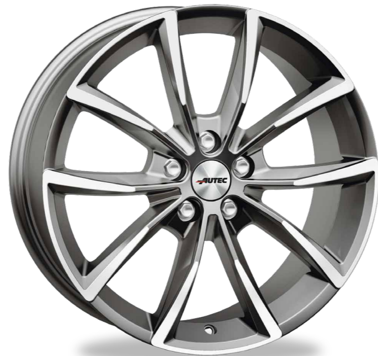
// TITANSILBER POLIERT