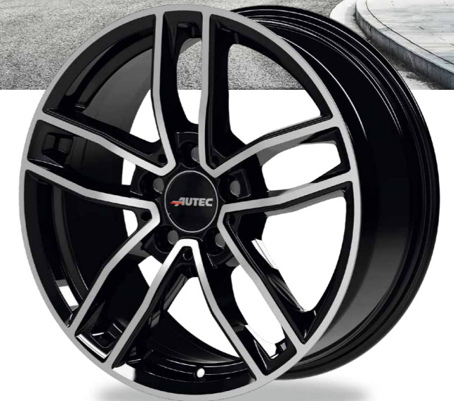
// SCHWARZ POLIERT