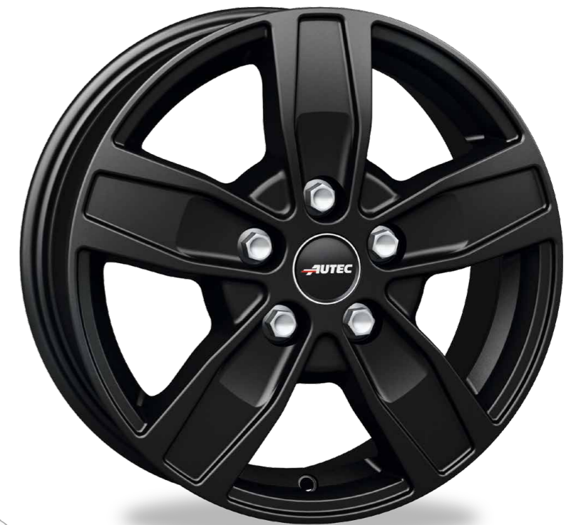
// SCHWARZ MATT