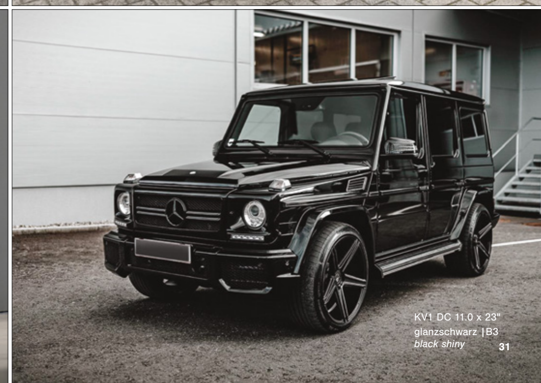
KV1 DC 11.0 x 23" glanzschwarz | B3 black shiny