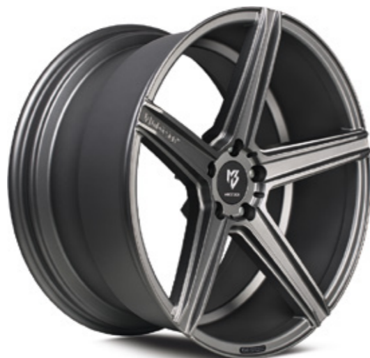
2 KV1 mattschwarz | B1 black matt