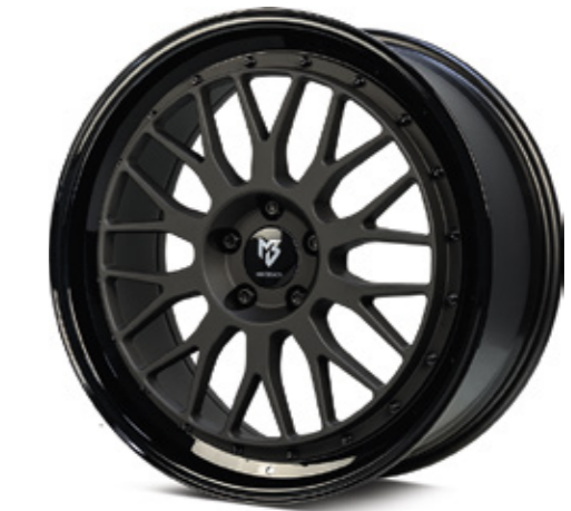
Stern center: schwarz stumpfmatt black matt |BP1 Bett rim: glanzschwarz black shiny |B3