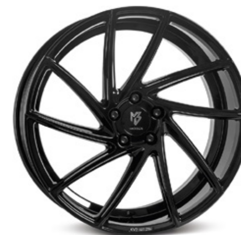
2 glanzschwarz | B3 black shiny