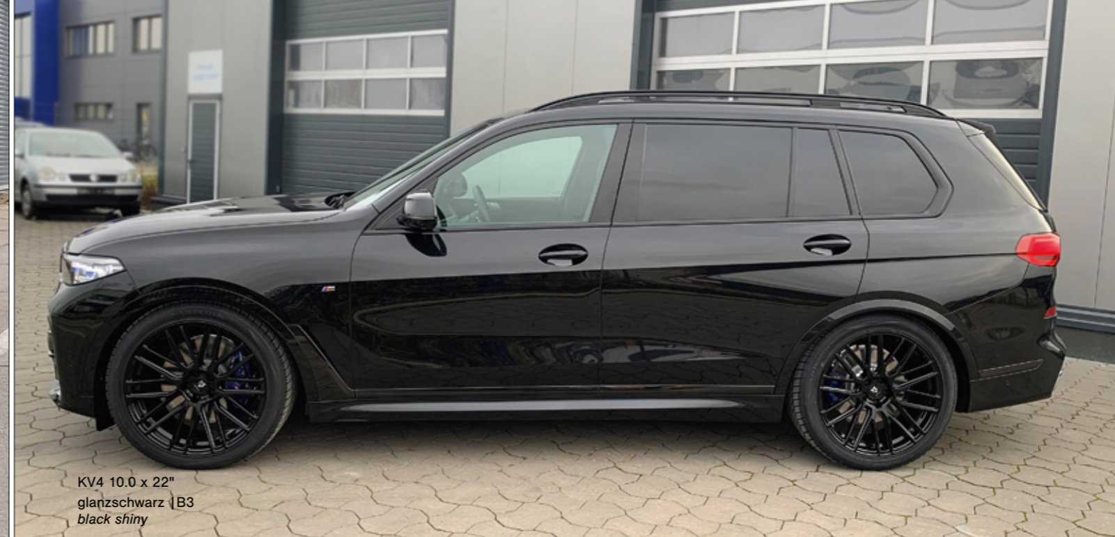
KV4 10.0 x 22" glanzschwarz | B3 black shiny