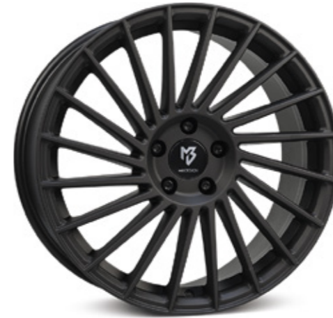
4 schwarz stumpfmatt | BP1 black matt