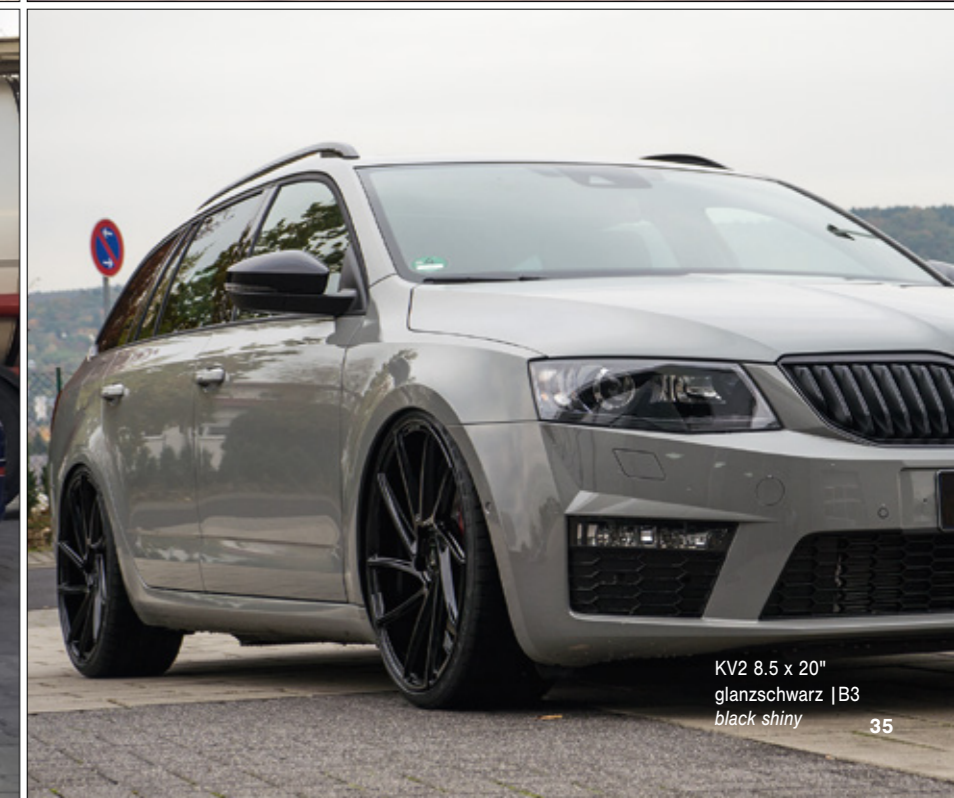
KV2 8.5 x 20" glanzschwarz | B3 black shiny