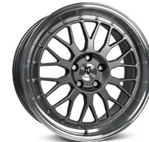
glanzgrau poliert |G4 grey shiny polish

optional optionally Center Lock Cap Zentralverschluss-Optik