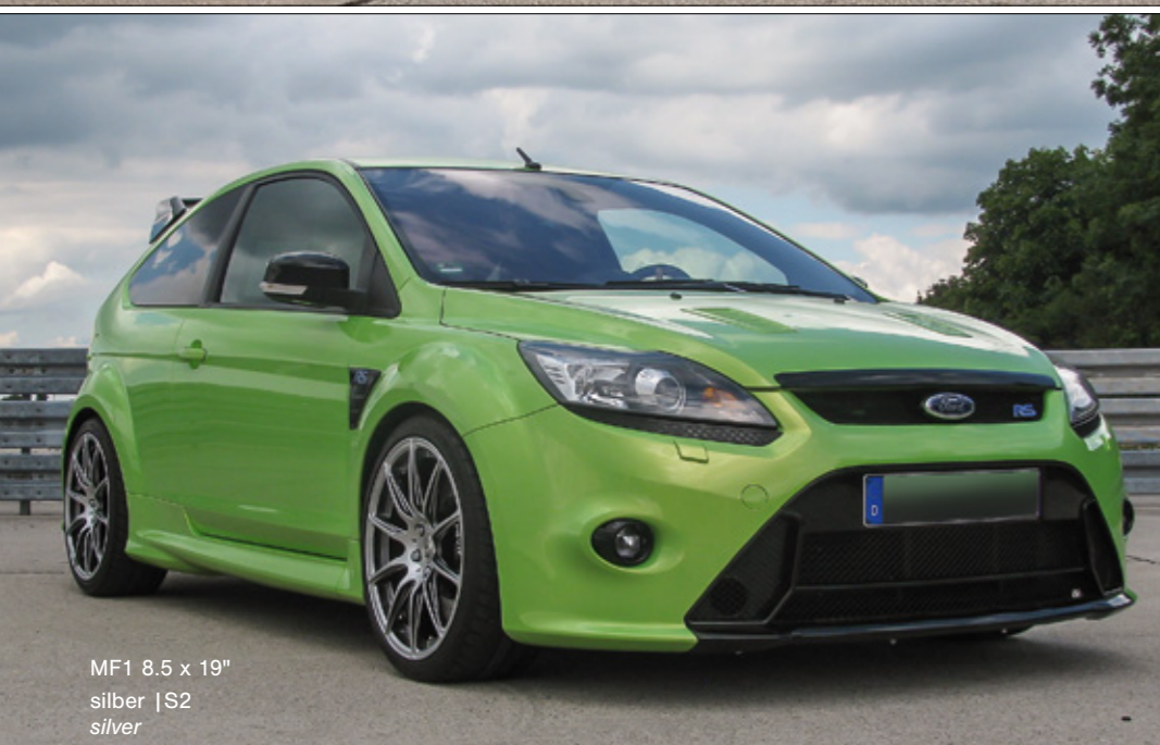
MF1 8.5 x 19" silber | S2 silver