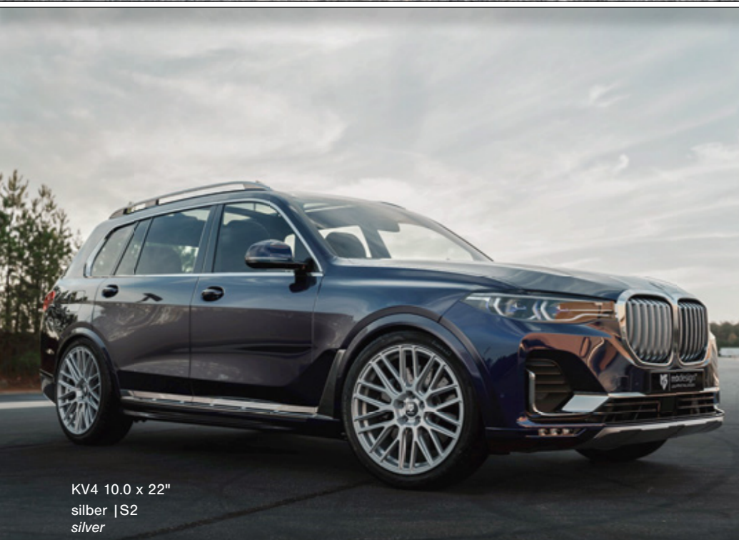
KV4 10.0 x 22" silber | S2 silver