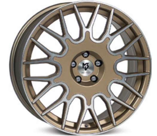
bronze hell matt poliert | BZL2 bronze light matt polish