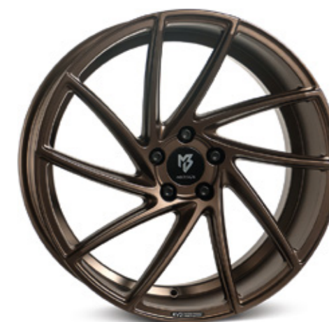
bronze seidenmatt | BZ1 bronze satin matt