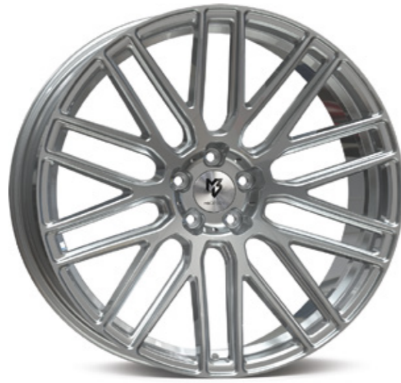
1 silber | S2 silver