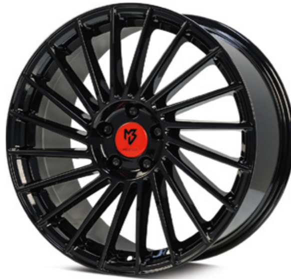
2 glanzschwarz | B3 black shiny