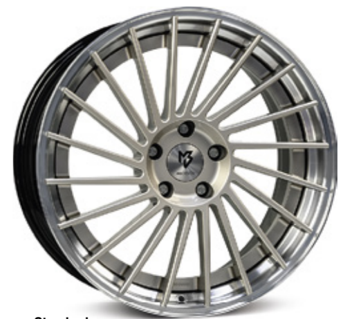
Standard Stern center: champagner champagne | CH3 Bett rim: glanzschwarz poliert black polish | B4