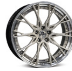
KV3.2 8 - 9 19" | 20" | 21" | 22" 2-teilig piece