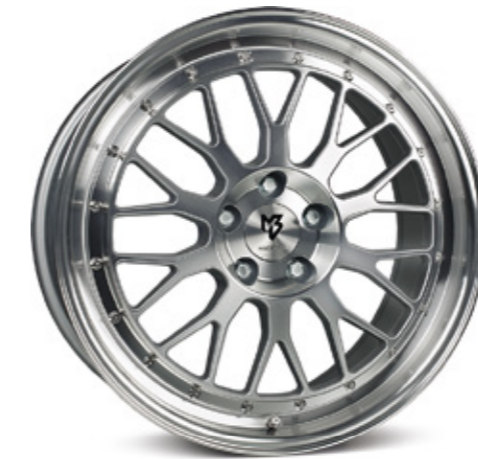
4 silber voll poliert |S4 silver full polish