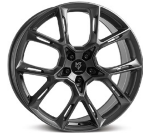
mattgrau | G1 grey matt