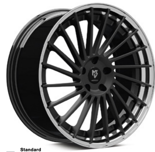
1 Standard Stern center: schwarz stumpfmatt black matt | BP1 Bett rim: glanzschwarz poliert black polish | B4