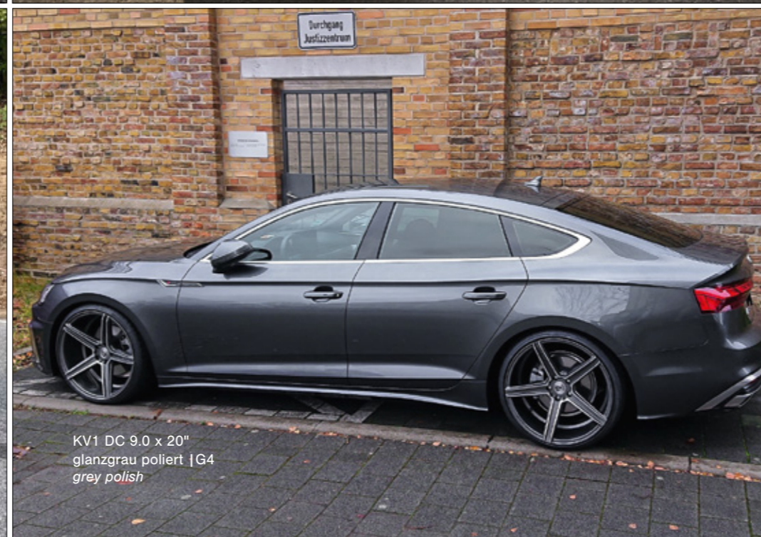
KV1 DC 9.0 x 20" glanzgrau poliert | G4 grey polish