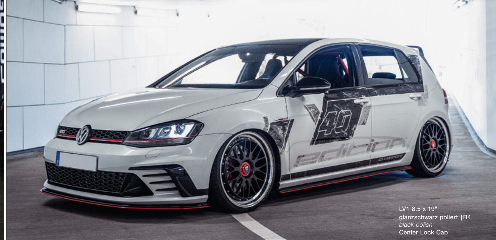
LV1 8.5 x 19" glanzschwarz poliert | B4 black polish Center Lock Cap