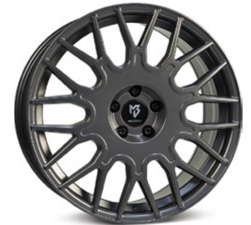
2 mattgrau | G1 grey matt