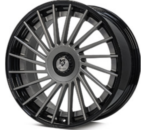
Standard Stern center: mattgrau grey matt | G1 Bett rim: glanzschwarz black shiny | B3

optional optionally Center Lock Cap Zentralverschluss-Optik