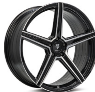
5 KV1 glanzgrau poliert | G4 grey shiny polish