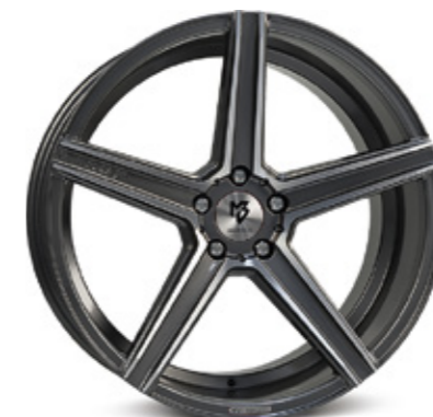
8 KV1S bronze hellmatt | BZL1 bronze light matt