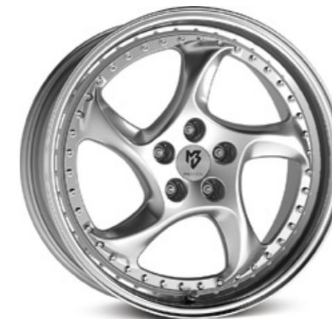
TURBO S silber poliert |S4 silver polish