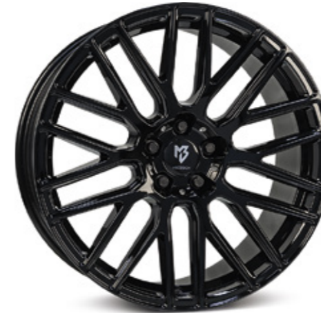
2 glanzschwarz | B3 black shiny