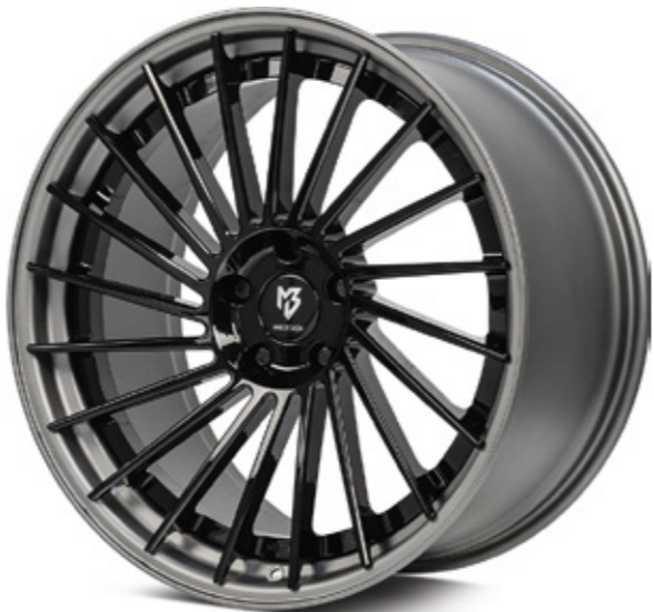
Standard Stern center: glanzschwarz black shiny | B3 Bett rim: mattgrau grey matt | G1

Radstern geschmiedet und gefräst center forged and milled Radstern konkav C / stark konkav DC center concave C/ deep concave DC für Pkw und Kompakt-SUV for passenger cars and compact SUV