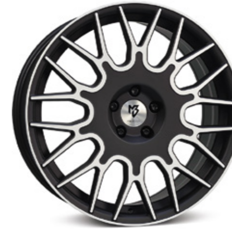
1 schwarz stumpfmatt poliert | BP2 black matt polish