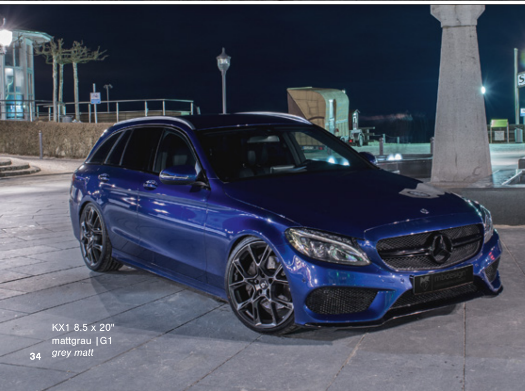
KX1 8.5 x 20" mattgrau | G1 grey matt