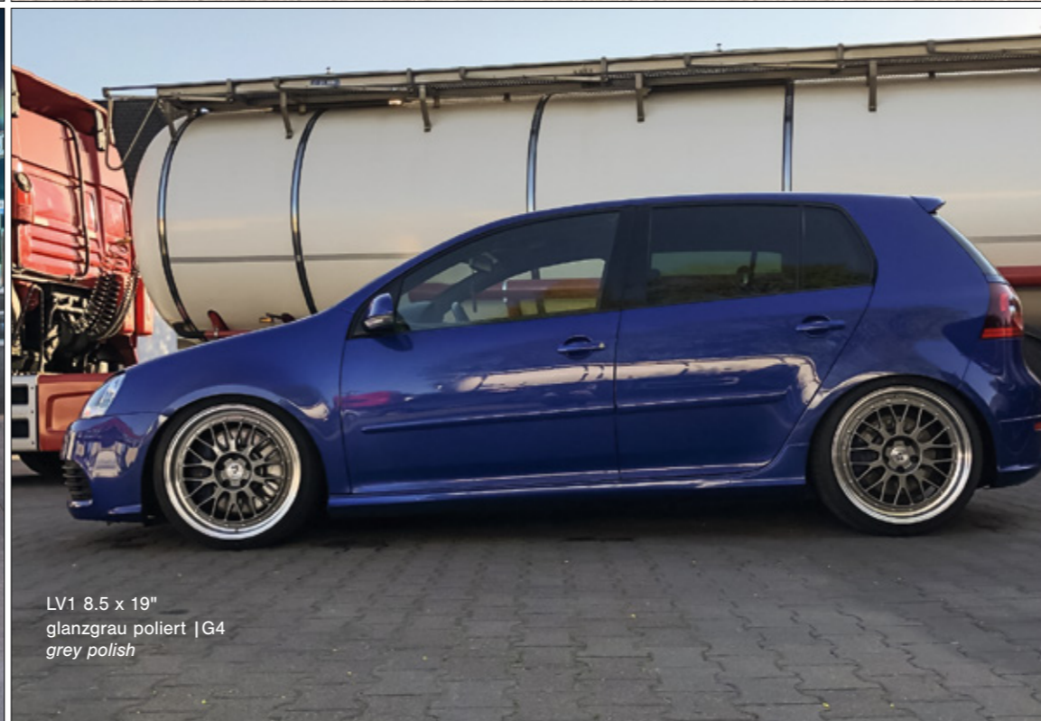
LV1 8.5 x 19" glanzgrau poliert | G4 grey polish