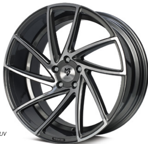
1 glanzgrau poliert | G4 grey shiny polish