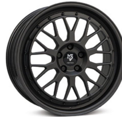
schwarz stumpfmatt |BP1 black matt