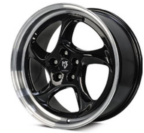
3 TURBO glanzschwarz poliert |B4 black polish