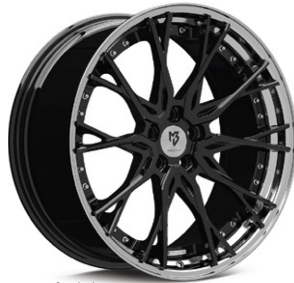
1 Standard Stern center: glanzschwarz black shiny | B3 Bett rim: glanzschwarz poliert black polish | B4

Radstern geschmiedet und gefräst center forged and milled Radstern konkav C / stark konkav DC center concave C/ deep concave DC für Pkw und Kompakt-SUV for passenger cars and compact SUV