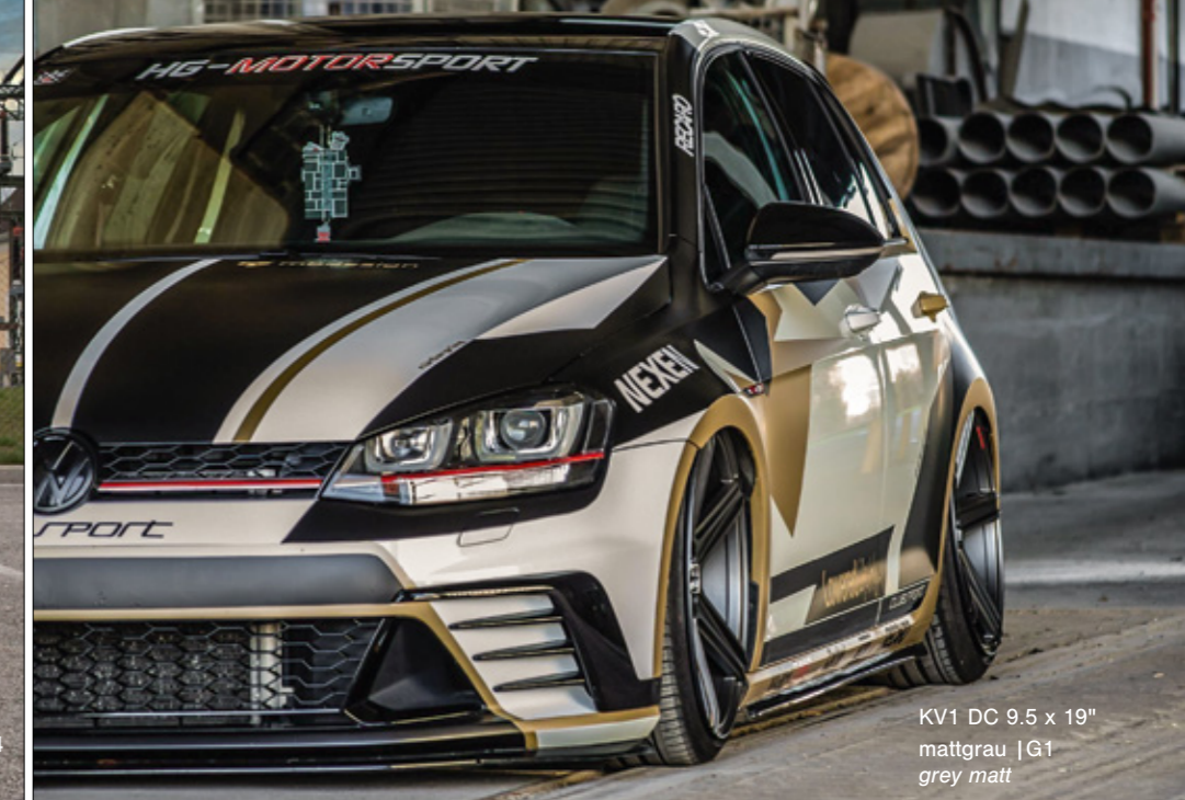
KV1 DC 9.5 x 19" mattgrau | G1 grey matt