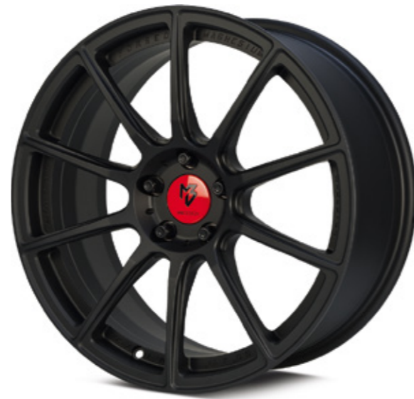
1 schwarz stumpfmatt | BP1 black matt