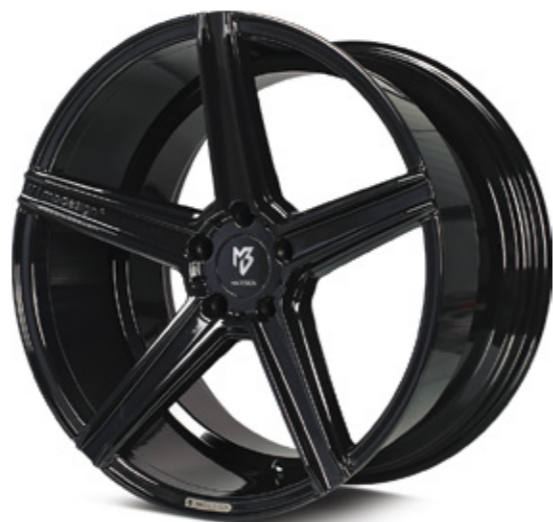
1 KV1 glanzschwarz | B3 black shiny