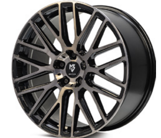
rauchschwarz glänzend poliert | BS4 black smoke polish