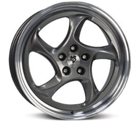
TURBO glanzgrau poliert |G4 grey shiny polish