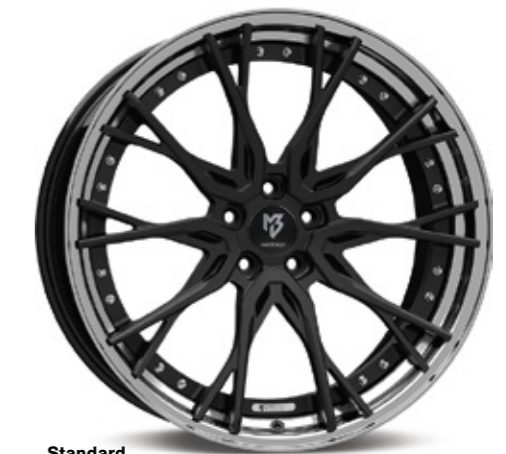
Standard Stern center: schwarz stumpfmatt black matt | BP1 Bett rim: glanzschwarz poliert black shiny polish | B4