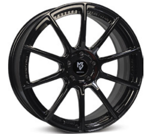
4 glanzschwarz | B3 black shiny