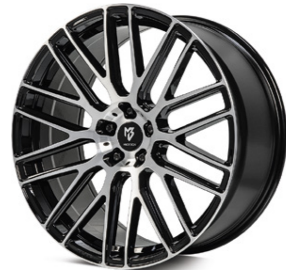
3 glanzschwarz poliert | B4 black shiny polish