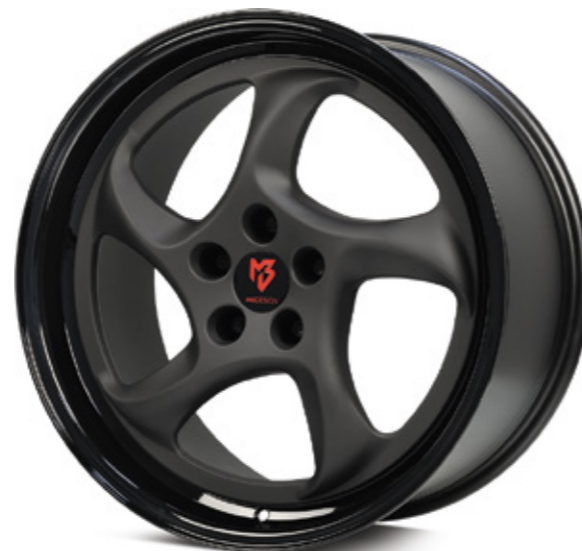
4 TURBO Stern center: schwarz stumpfmatt black matt |BP1 Bett rim: glanzschwarz black shiny |B3