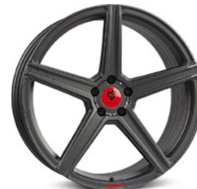
9 KV1S mattschwarz | G1 grey matt