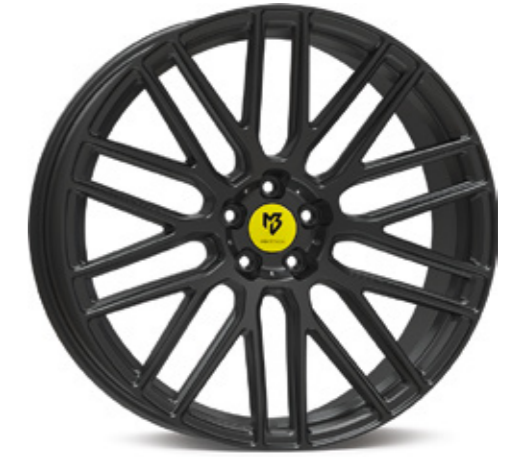
mattgrau | G1 grey matt