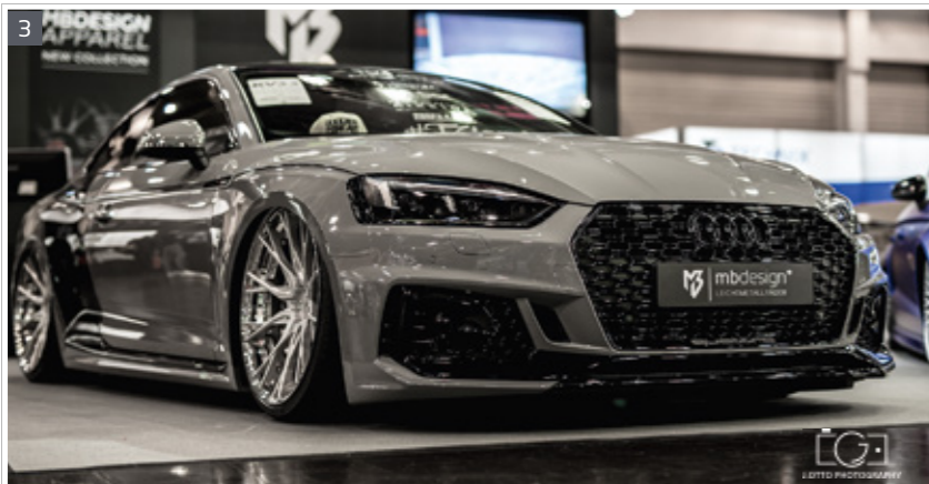
3 Aufpreis extra charge Stern center: silber silver | S2 - Bett rim: glanzschwarz black polish | B3