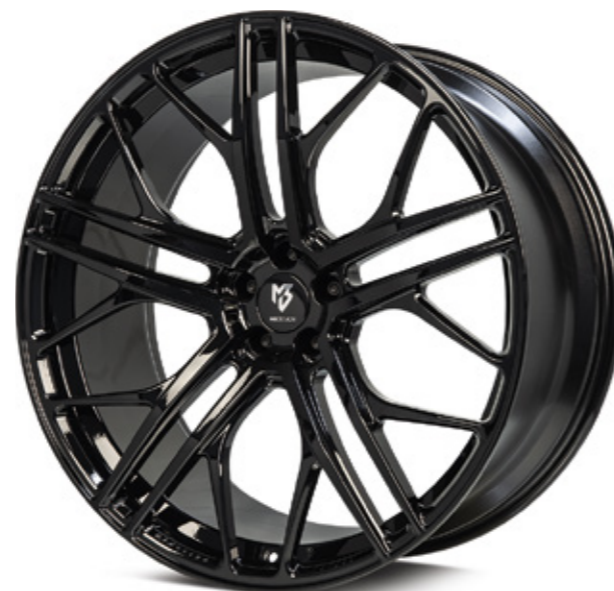
glanzschwarz | B3 black shiny

geschmiedet und gefräst forged and milled Radstern konkav C center concave C für SUV for SUV 1050kg Traglast wheel load