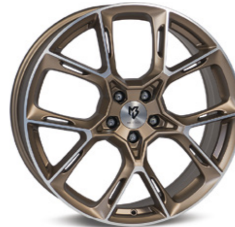
bronze hell matt poliert | BZL2 bronze light matt polish