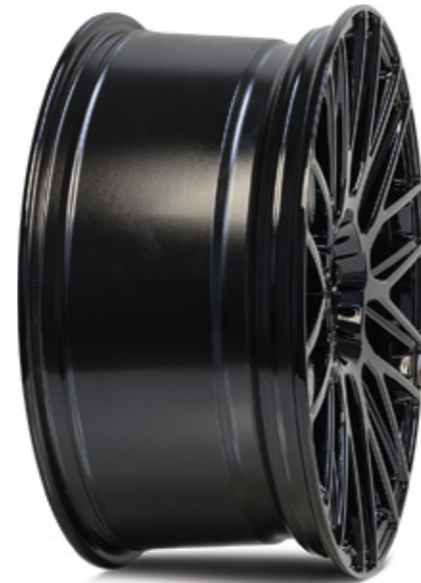
2 glanzschwarz | B3 black shiny