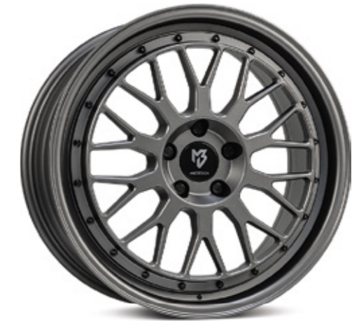
mattgrau |G1 grey matt