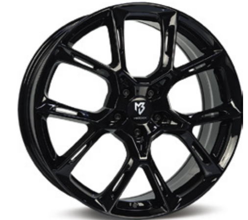
2 glanzschwarz | B3 black shiny