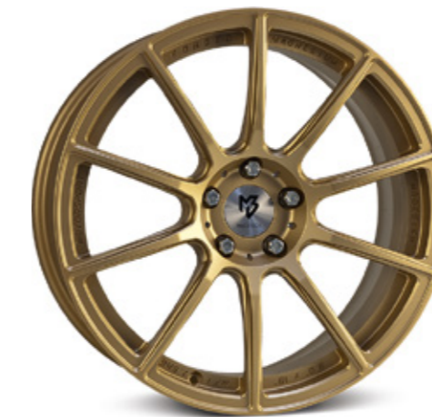
gold matt | GO1 gold matt