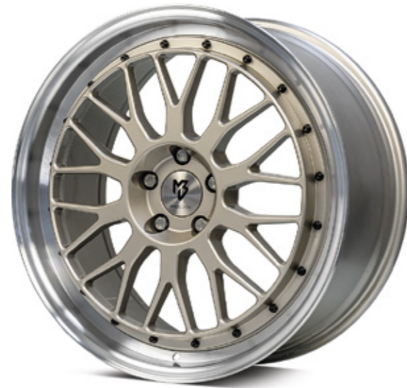
1 champagner poliert |CH4 champagne polish