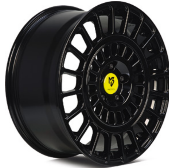
2 glanzschwarz | B3 black shiny