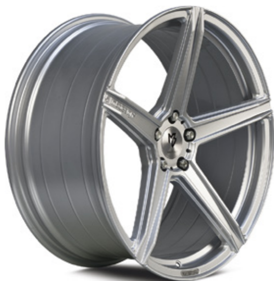
11 KV1S silber | S2 silver