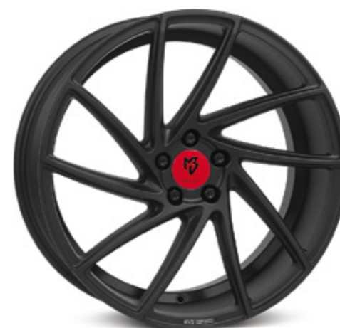
schwarz stumpfmatt | BP1 black matt