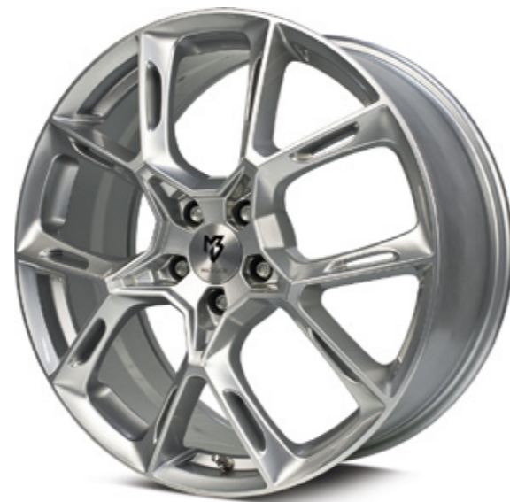
1 silber | S2 silver