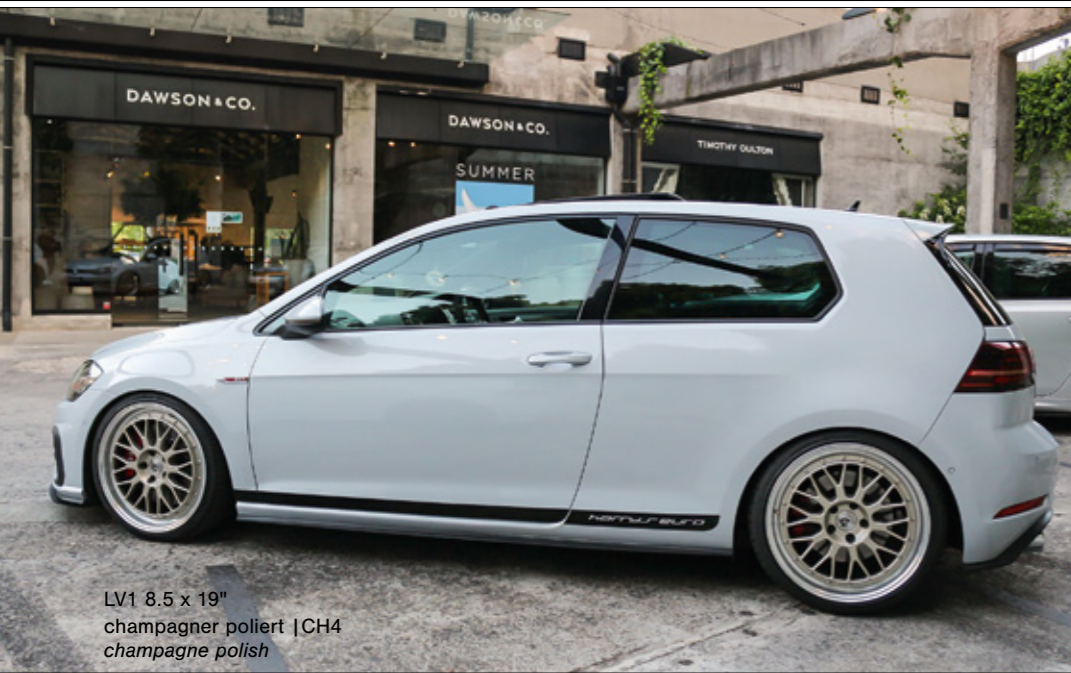
LV1 8.5 x 19" champagner poliert | CH4 champagne polish