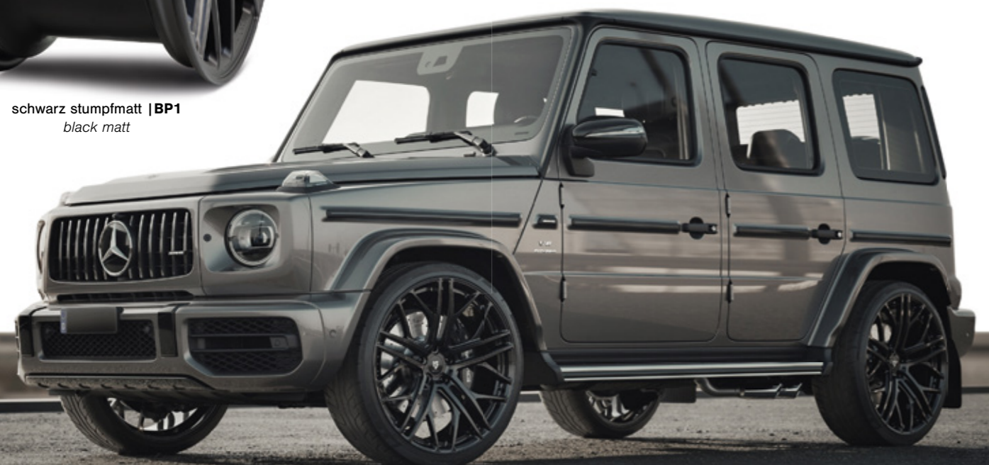
schwarz stumpfmatt | BP1 black matt