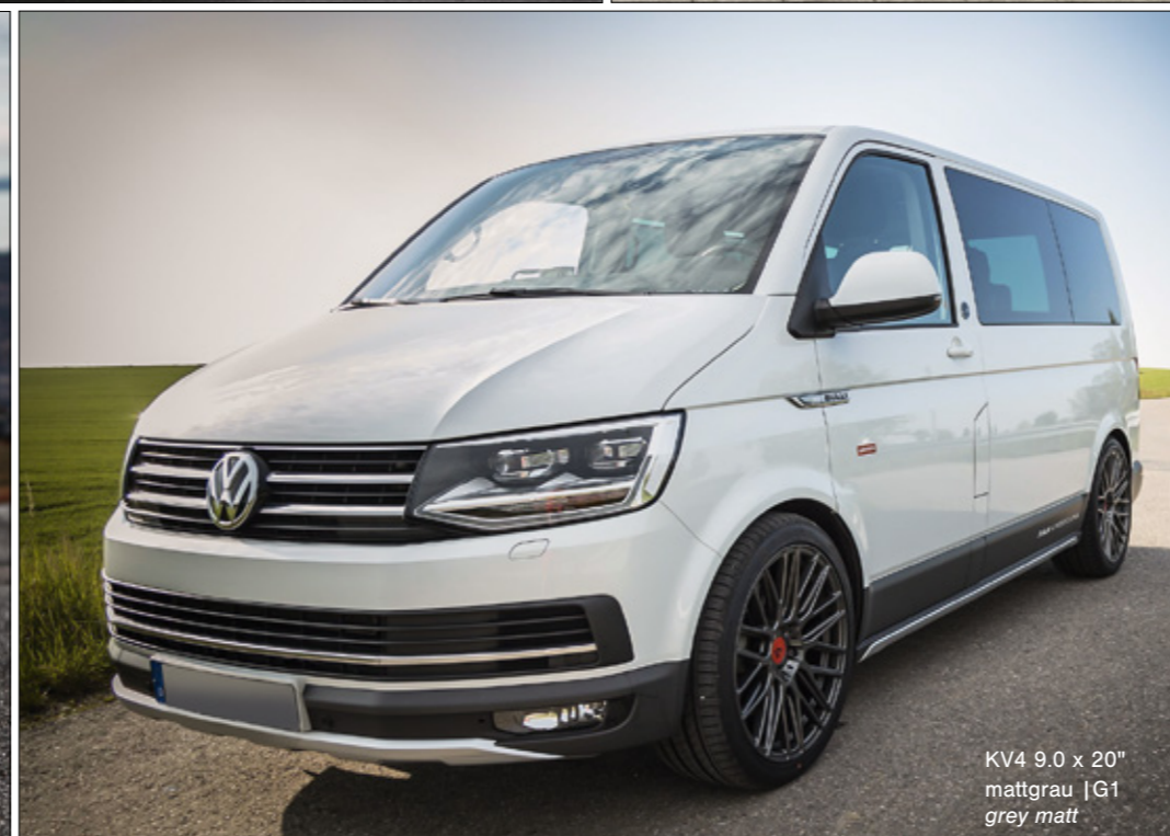
KV4 9.0 x 20" mattgrau | G1 grey matt