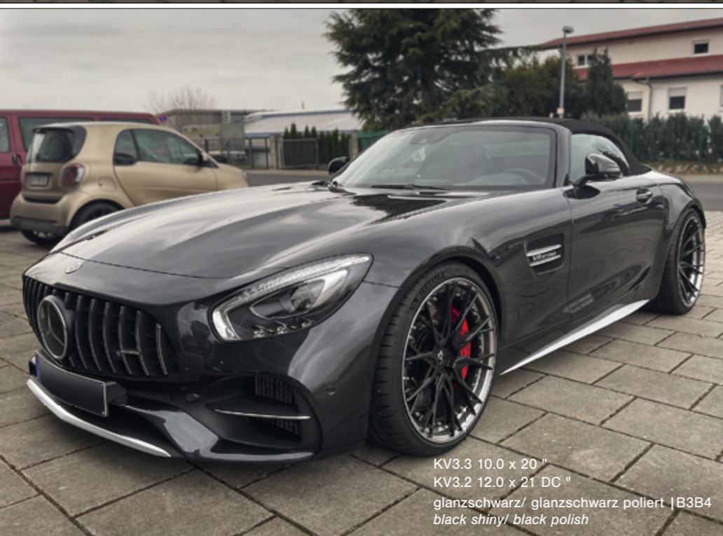
KV3.3 10.0 x 20" KV3.2 12.0 x 21 DC" glanzschwarz/ glanzschwarz poliert | B3B4 black shiny/ black polish