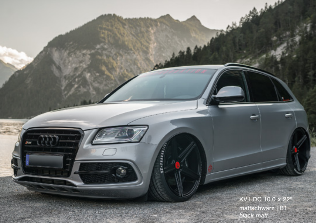
KV1 DC 10.0 x 22" mattschwarz | B1 black matt