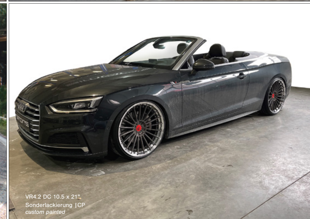
VR4.2 DC 10.5 x 21" Sonderlackierung | CP custom painted