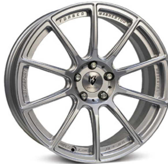
2 silber | S2 silver