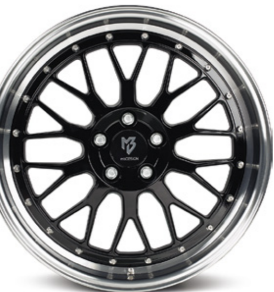
3 glanzschwarz poliert |B4 black shiny polish