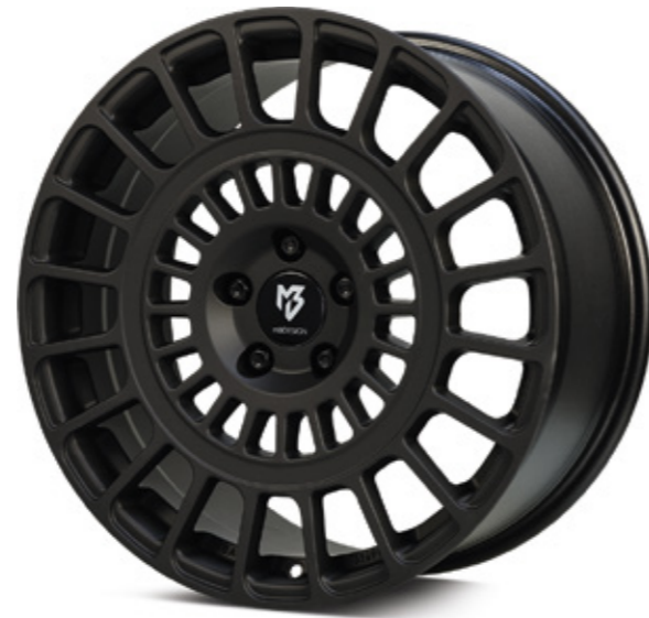
1 schwarz stumpfmatt | BP1 black matt