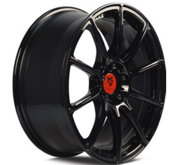
4 glanzschwarz | B3 black shiny