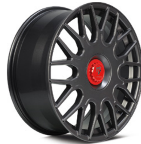
optional optionally Center Lock Cap Zentralverschluss-Optik

Mutter und Teller aus Aluminium gefertigt in verschiedenen Farbkombinationen Aluminum nut and plate, different color combinations