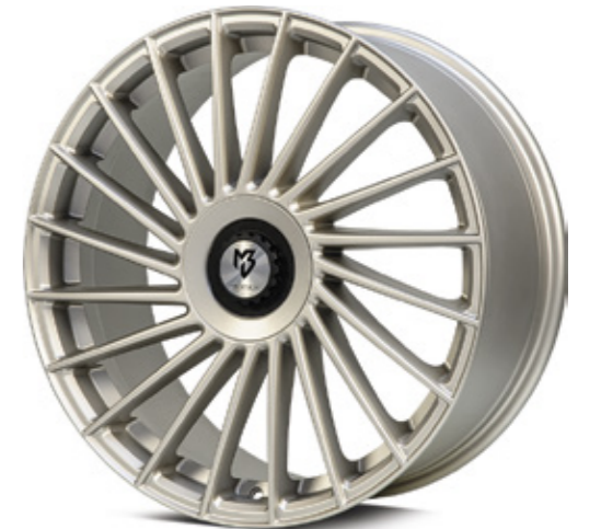
optional optionally Center Lock Cap Zentralverschluss-Optik