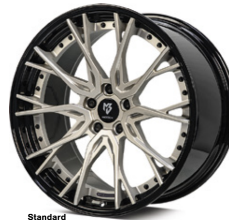
Standard Stern center: champagner matt champagne matt | CH1 Bett rim: glanzschwarz black shiny | B3