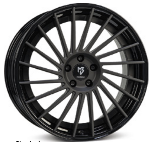
Standard Stern center: schwarz stumpfmatt black matt | BP1 Bett rim: glanzschwarz black shiny | B3