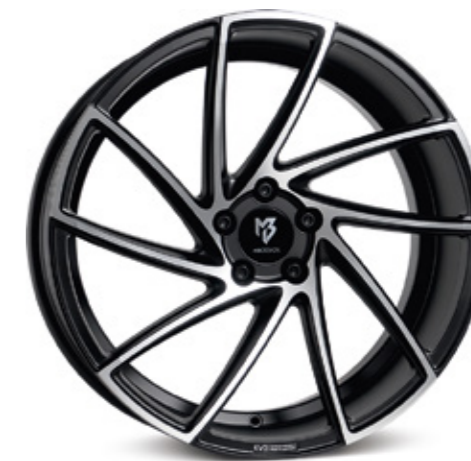
mattschwarz poliert | B2 black matt polish