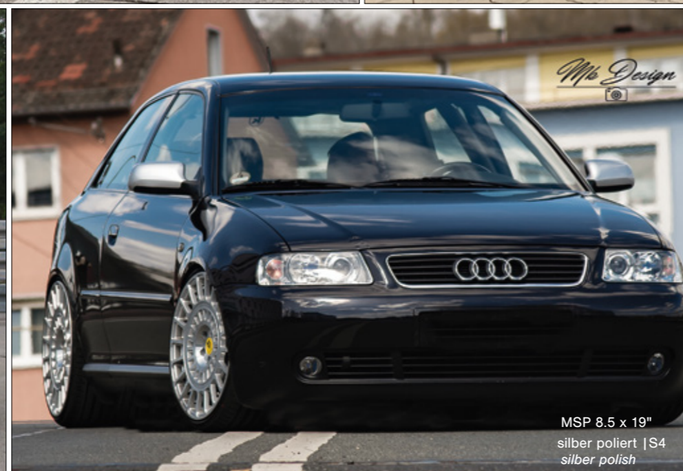
MSP 8.5 x 19" silber poliert | S4 silver polish