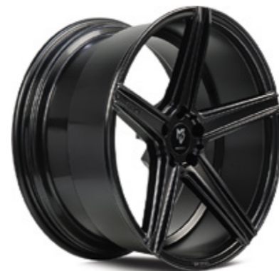
3 KV1 glanzgrau | G3 grey shiny