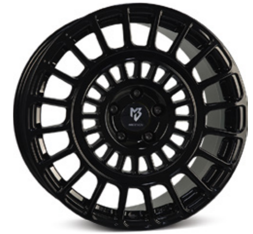
2 glanzschwarz | B3 black shiny