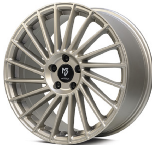
3 champagner matt | CH1 champagne matt