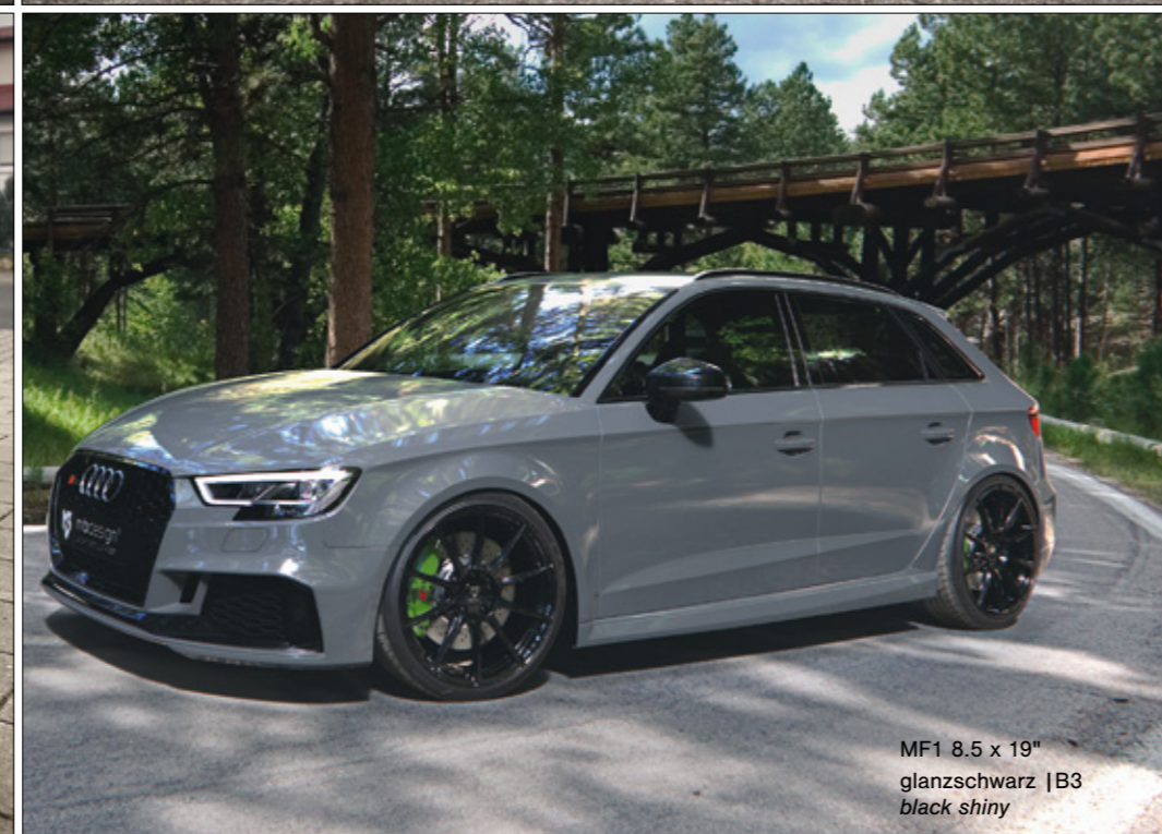
MF1 8.5 x 19" glanzschwarz | B3 black shiny