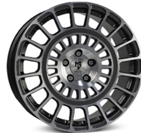
glanzgrau poliert | G4 grey shiny polish