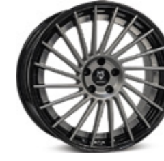
VR3.2 28 - 29 19" | 20" | 21" | 22" 2-teilig piece