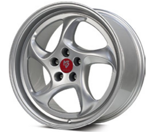
TURBO silber |S2 silver