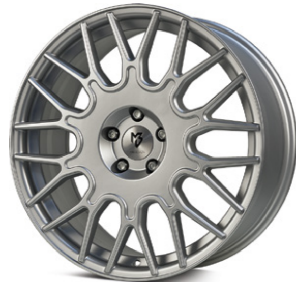
3 silber matt | SD1 silver matt