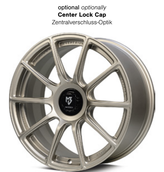
optional optionally Center Lock Cap Zentralverschluss-Optik

Mutter und Teller aus Aluminium gefertigt in verschiedenen Farbkombinationen Aluminum nut and plate, different color combinations