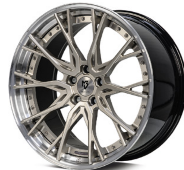
Standard Stern center: champagner champagne | CH3 Bett rim: glanzschwarz poliert black polish | B4