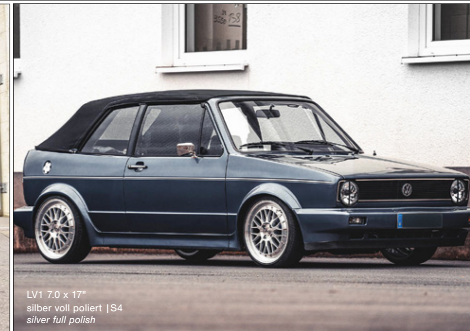
LV1 7.0 x 17" silber voll poliert | S4 silver full polish