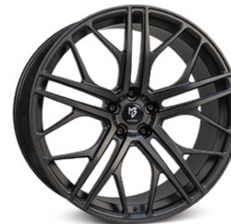
schwarz stumpfmatt | BP1 black matt