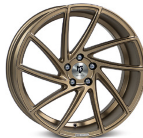
bronze hell matt | BZL1 bronze light matt