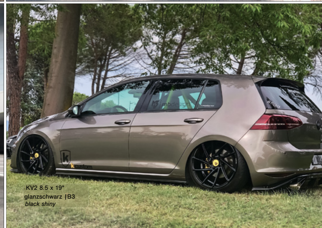
KV2 8.5 x 19" glanzschwarz | B3 black shiny