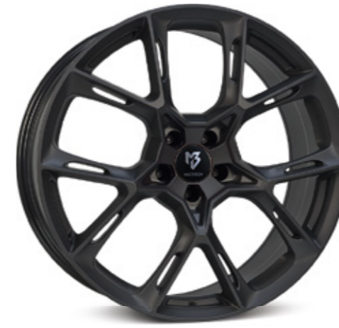
schwarz stumpfmatt | BP1 black matt