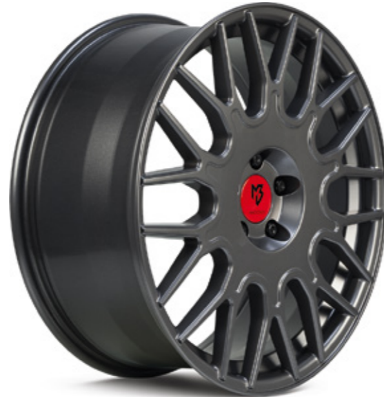
2 mattgrau | G1 grey matt