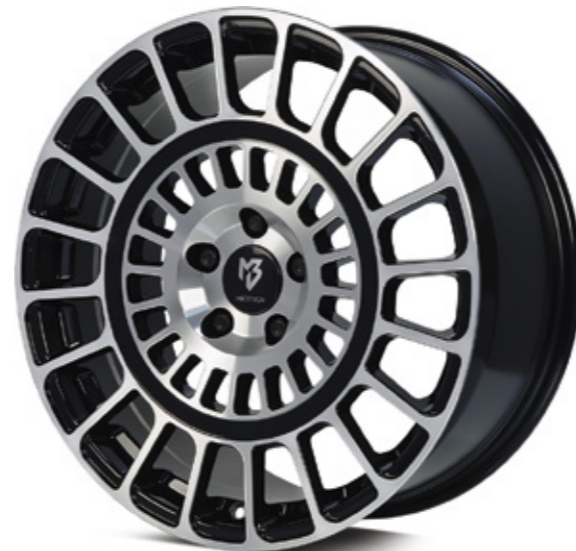
3 glanzschwarz poliert | B4 black shiny polish