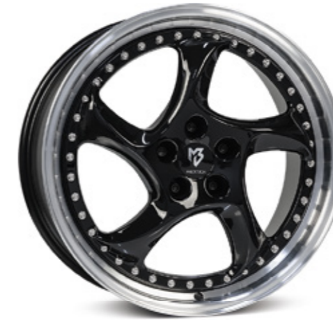
TURBO S glanzschwarz poliert |B4 black polish