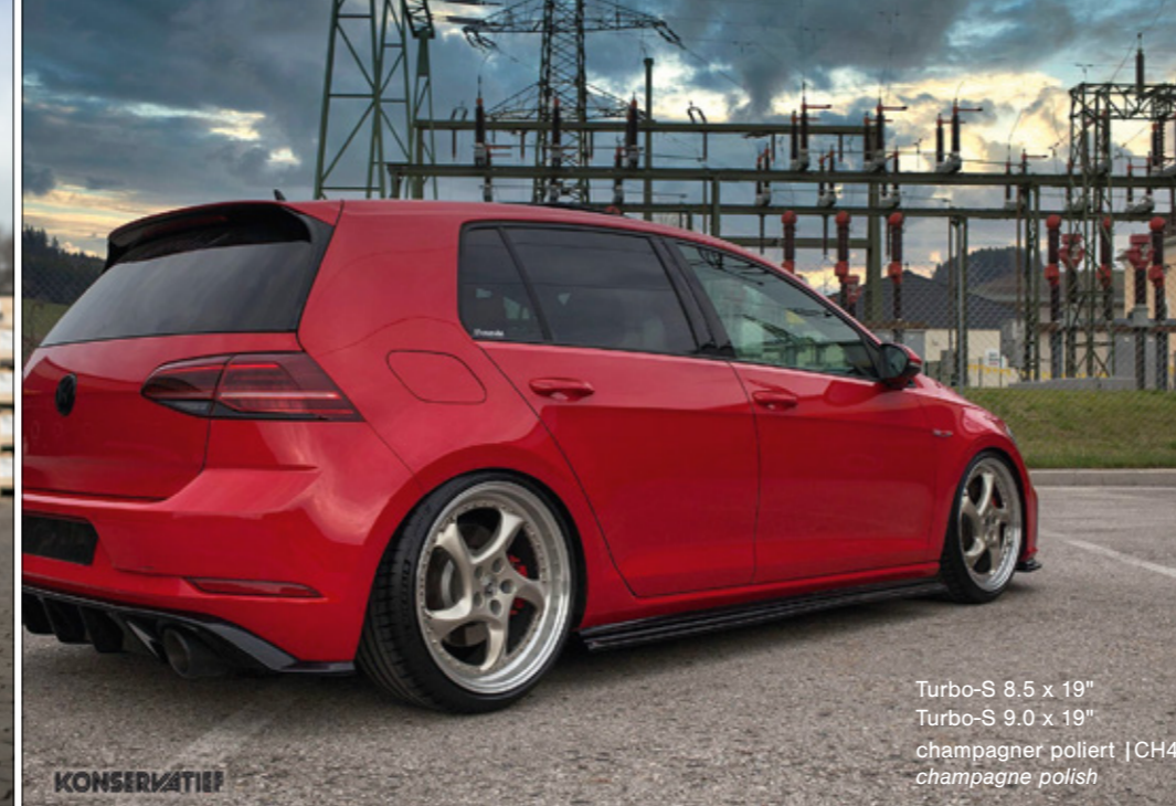
Turbo-S 8.5 x 19" Turbo-S 9.0 x 19" champagner poliert | CH4 champagne polish