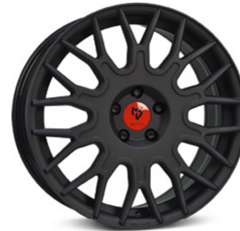
schwarz stumpfmatt | BP1 black matt