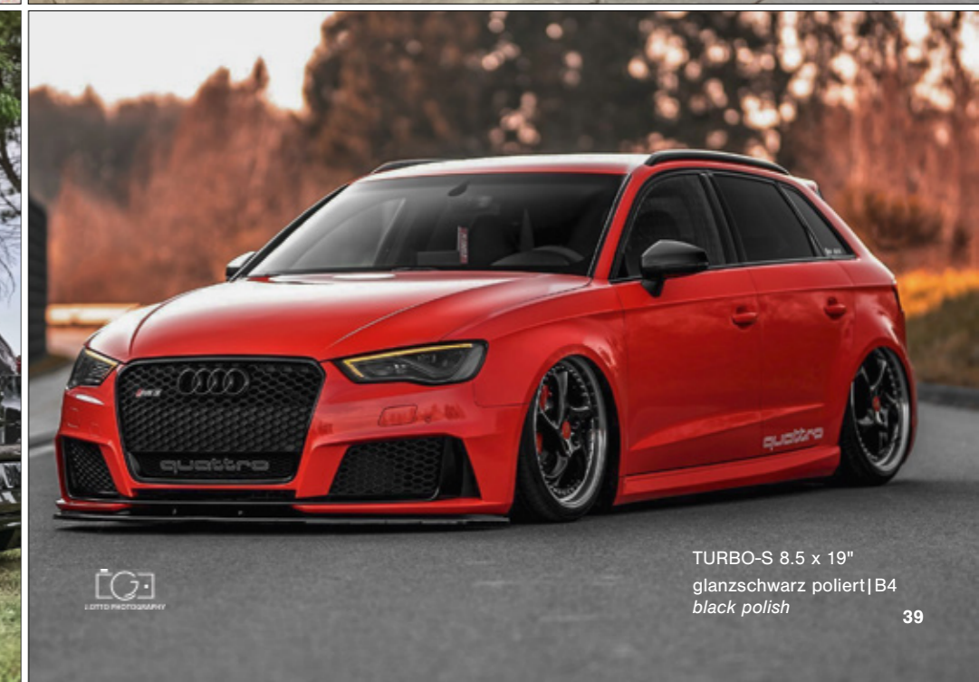
TURBO-S 8.5 x 19" glanzschwarz poliert | B4 black polish