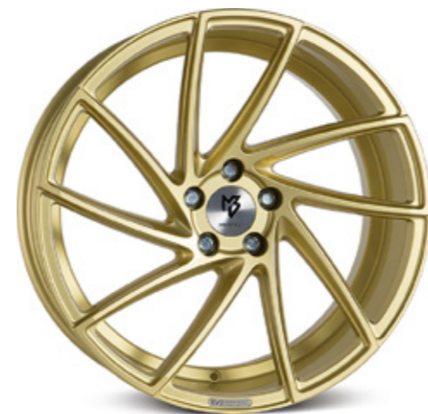
gold glänzend | GO3 gold shiny