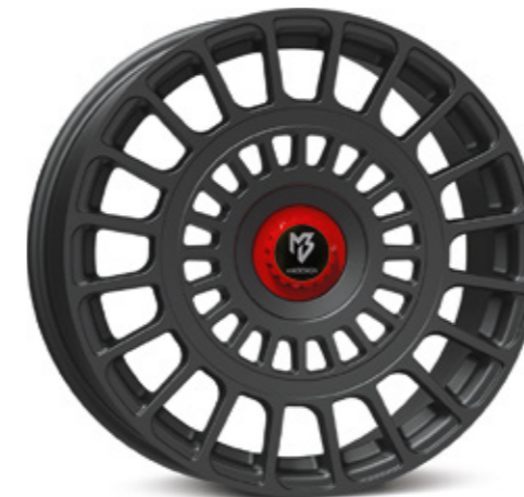
optional optionally Center Lock Cap Zentralverschluss-Optik

Mutter und Teller aus Aluminium gefertigt in verschiedenen Farbkombinationen Aluminum nut and plate, different color combinations