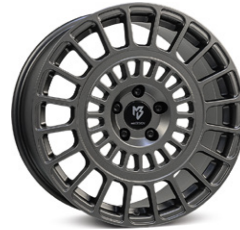
mattgrau | G1 grey matt