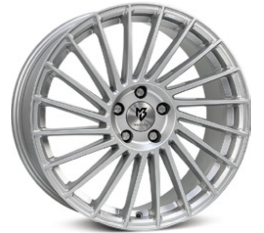
silber | S2 silver