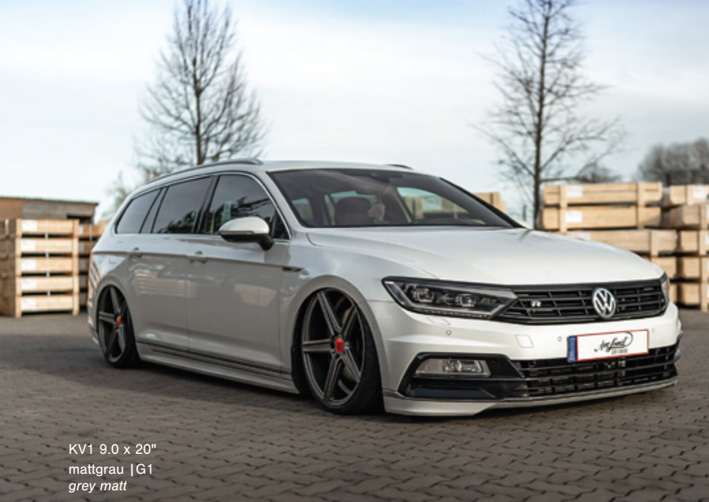
KV1 9.0 x 20" mattgrau | G1 grey matt