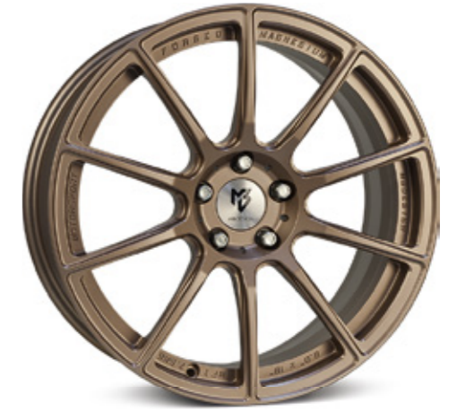
bronze hell matt | BZL1 bronze light matt