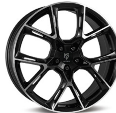
glanzschwarz poliert | B4 black shiny polish