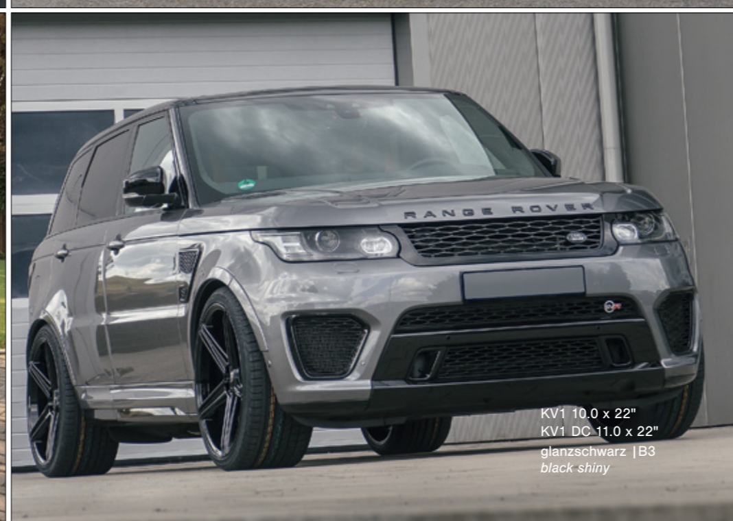
KV1 10.0 x 22" KV1 DC 11.0 x 22" glanzschwarz | B3 black shiny