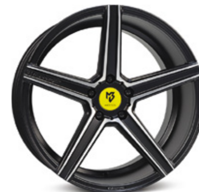
7 KV1S mattschwarz | G1 grey matt