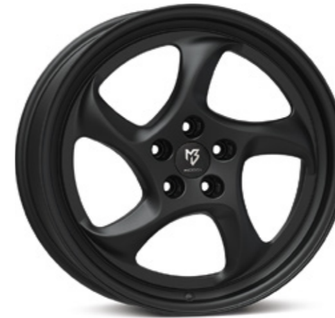
TURBO schwarz stumpfmatt |BP1 black matt