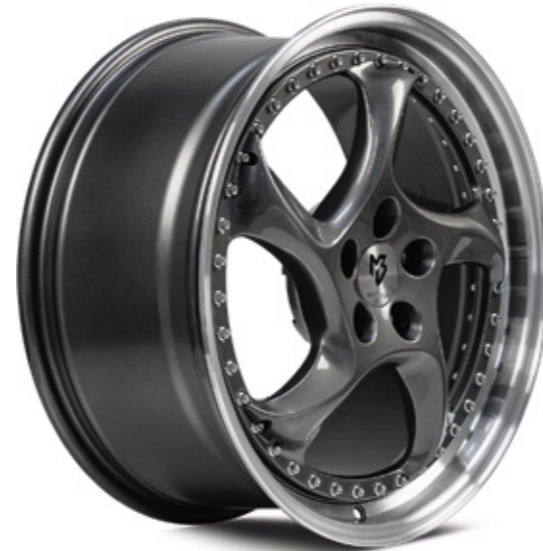
2 TURBO S glanzgrau poliert |G4 grey shiny polish