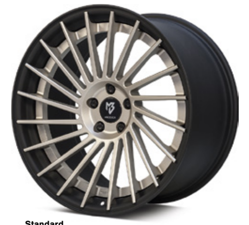
Standard Stern center: champagner matt champagne matt | CH1 Bett rim: mattschwarz black matt | BP1