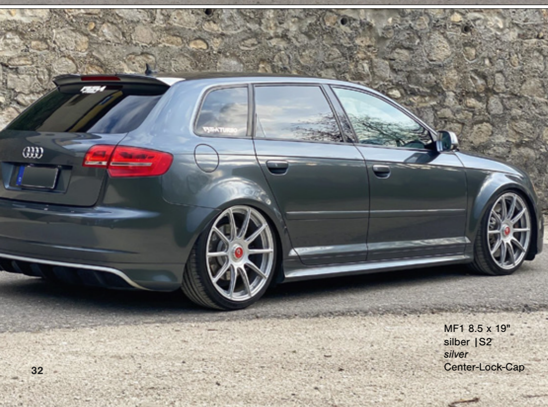
MF1 8.5 x 19" silber | S2 silver Center-Lock-Cap