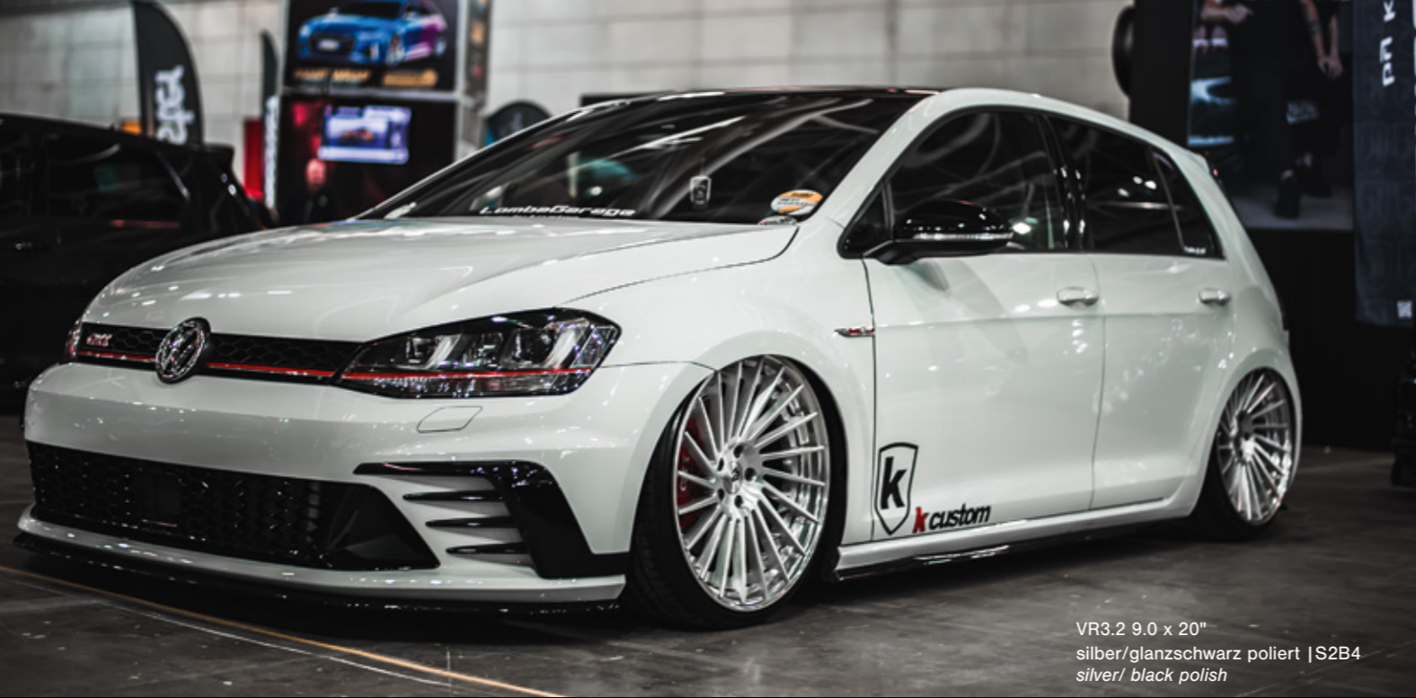
VR3.2 9.0 x 20" silber/glanzschwarz poliert | S2B4 silver/ black polish