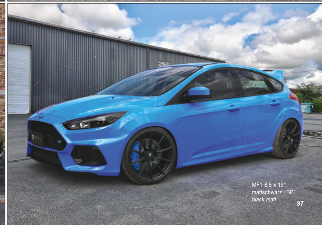
MF1 8.5 x 19" mattschwarz | BP1 black matt