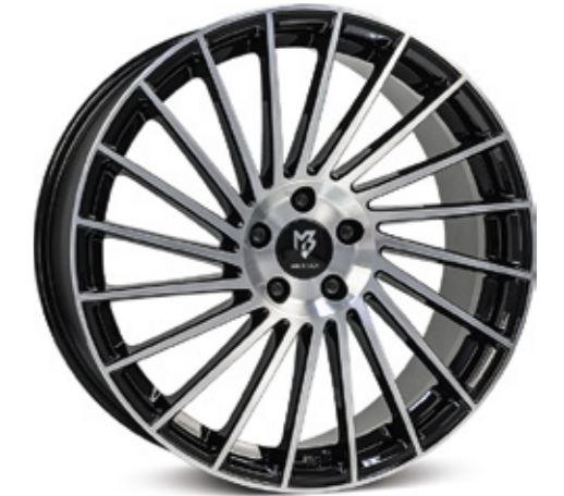
glanzschwarz poliert | B3 black shiny polish