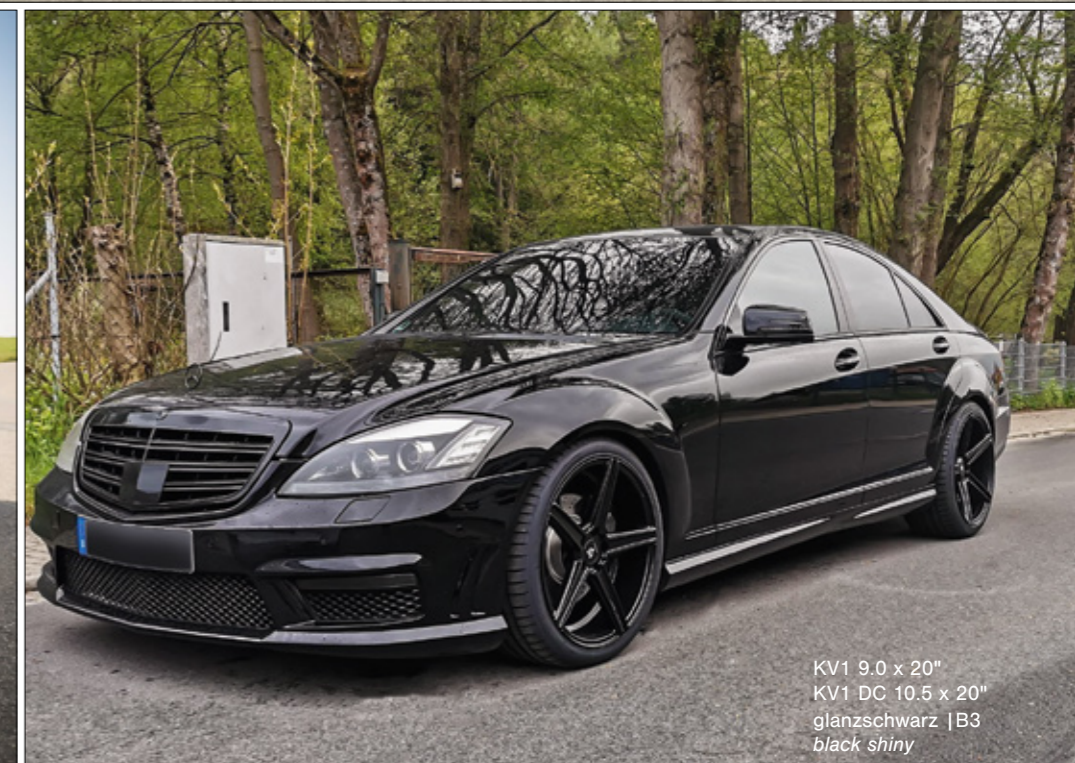
KV1 9.0 x 20" KV1 DC 10.5 x 20" glanzschwarz | B3 black shiny