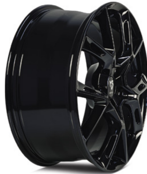
2 glanzschwarz | B3 black shiny