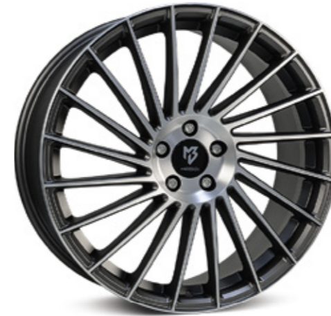
mattgrau poliert | G2 grey matt polish