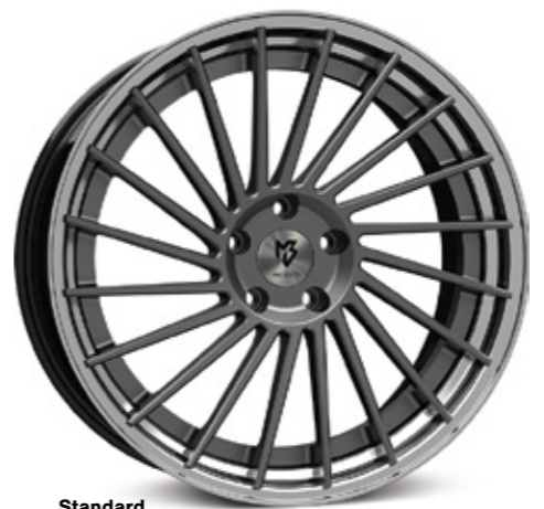
Standard Stern center: mattgrau grey matt | G1 Bett rim: glanzschwarz poliert black polish | B4