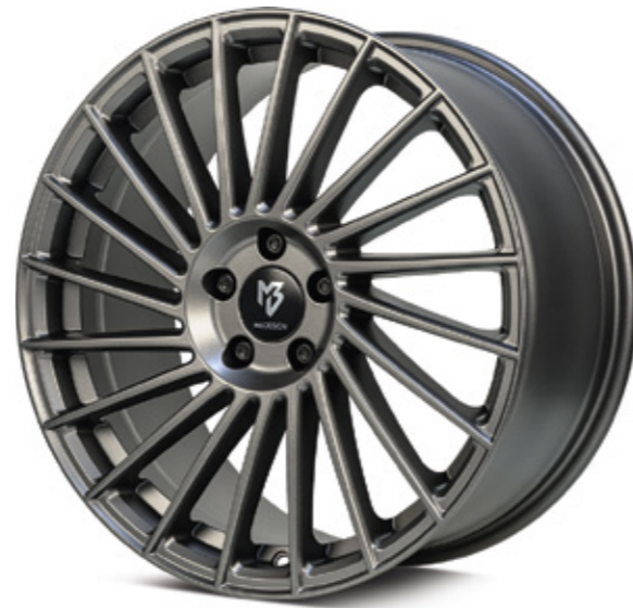
1 mattgrau | G1 grey matt