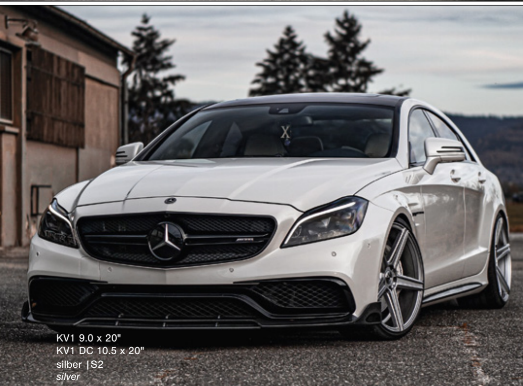
KV1 9.0 x 20" KV1 DC 10.5 x 20" silber | S2 silver