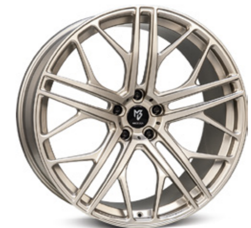
champagner | CH3 champagne