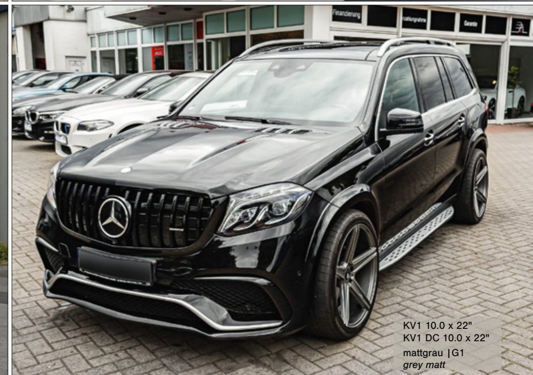
KV1 10.0 x 22" KV1 DC 10.0 x 22" mattgrau | G1 grey matt