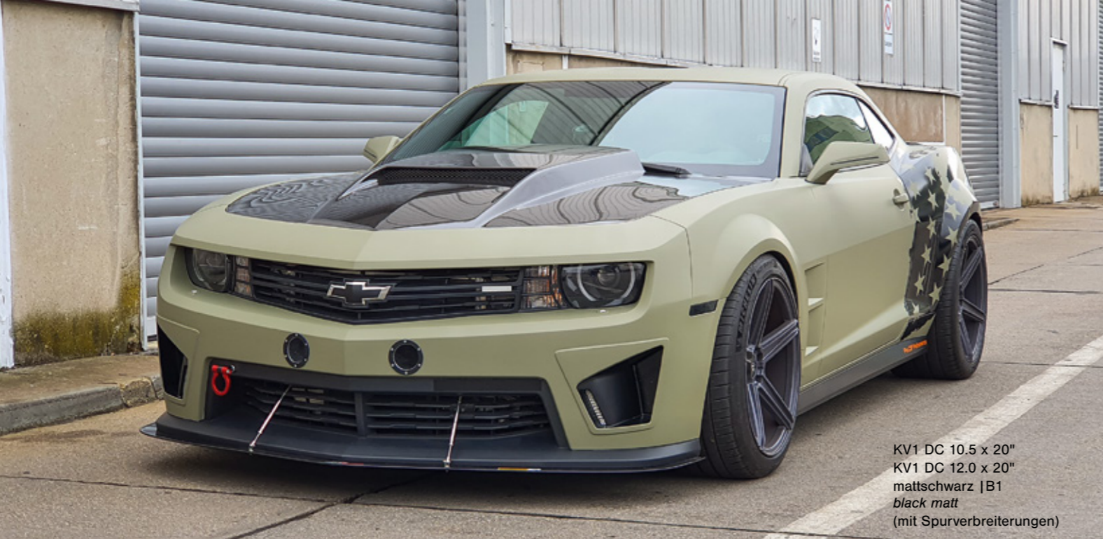
KV1 DC 10.5 x 20" KV1 DC 12.0 x 20" mattschwarz | B1 black matt (mit Spurverbreiterungen)