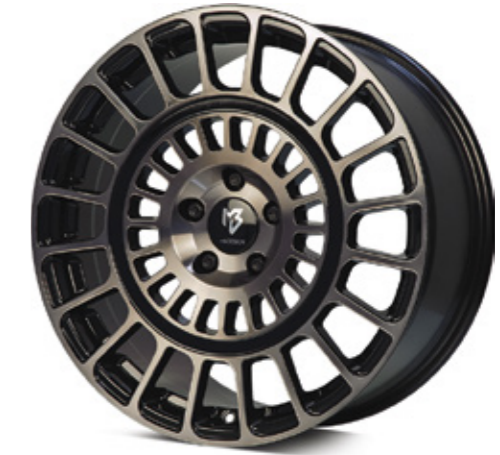
rauchschwarz glänzend poliert | BS4 black smoke shiny polish