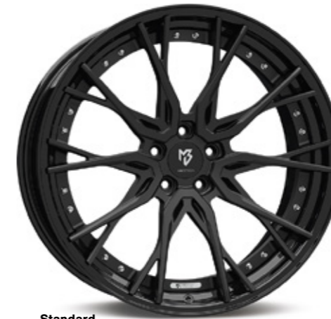
Standard Stern center: schwarz stumpfmatt black matt | BP1 Bett rim: glanzschwarz black shiny | B3