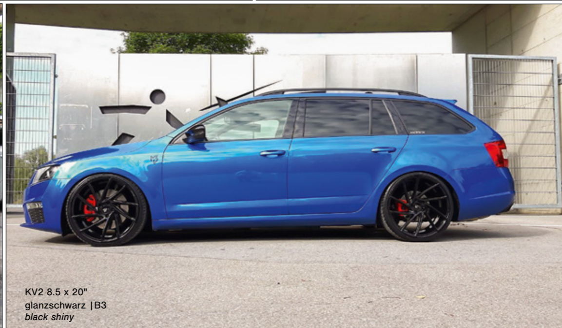
KV2 8.5 x 20" glanzschwarz | B3 black shiny