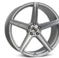
KV1/-S 4 - 5 19" | 20" | 21" | 22" | 23"