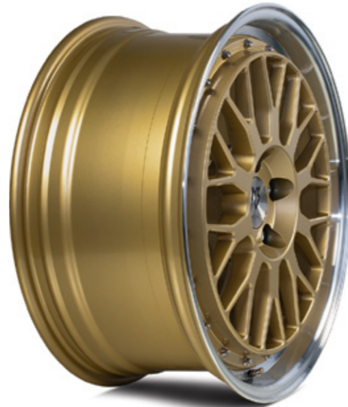
2 gold poliert |GO4 gold shiny polish