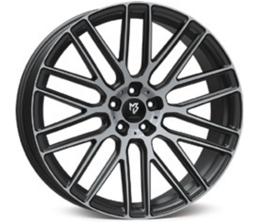
mattgrau poliert | G2 grey matt polish