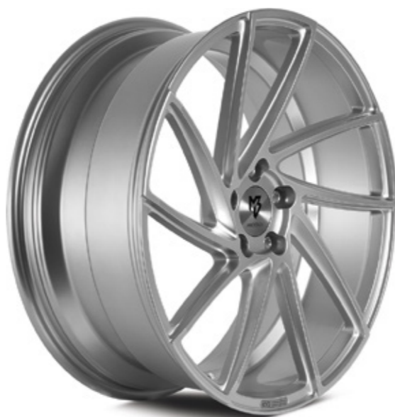
3 silber | S2 silver