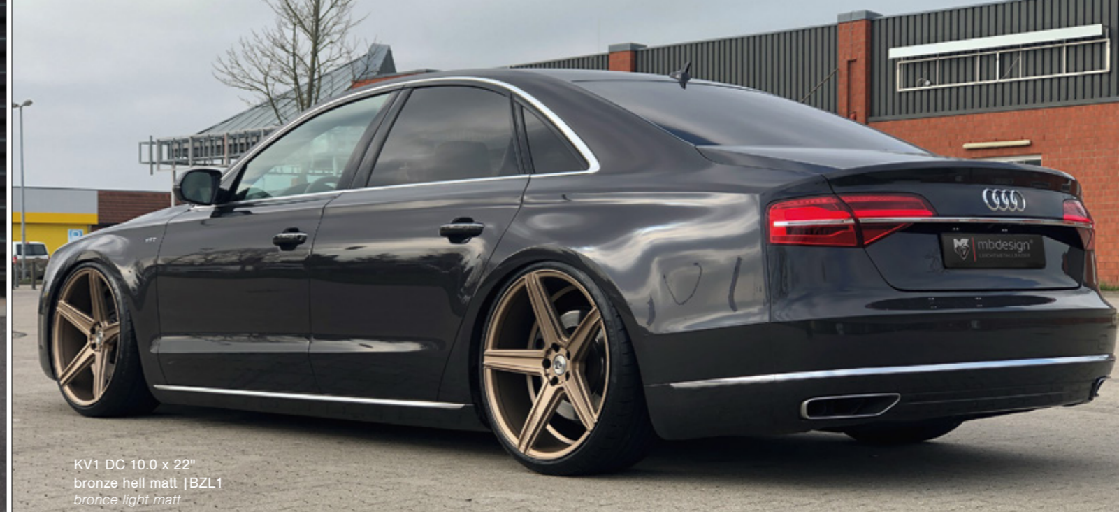
KV1 DC 10.0 x 22" bronze hell matt | BZL1 bronze light matt