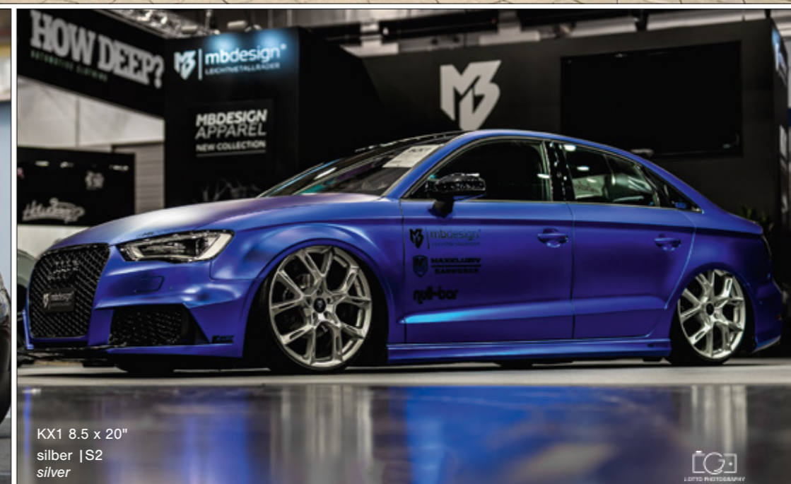
KX1 8.5 x 20" silber | S2 silver