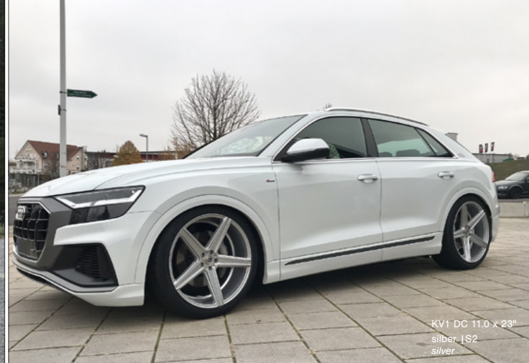
KV1 DC 11.0 x 23" silber | S2 silver