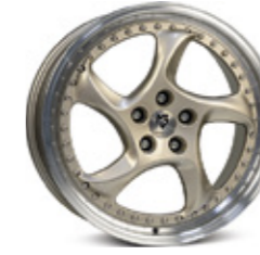
TURBO/S 24 - 25 19"