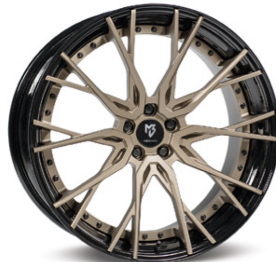
2 Aufpreis extra charge Stern center: bronze hell matt bronze light matt | BZL1 Bett rim: glanzschwarz black shiny | B3