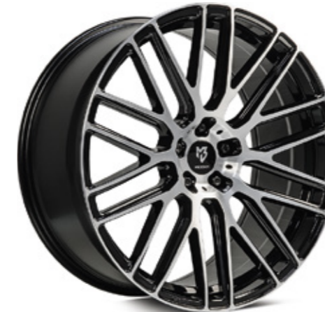
3 glanzschwarz poliert | B4 black shiny polish