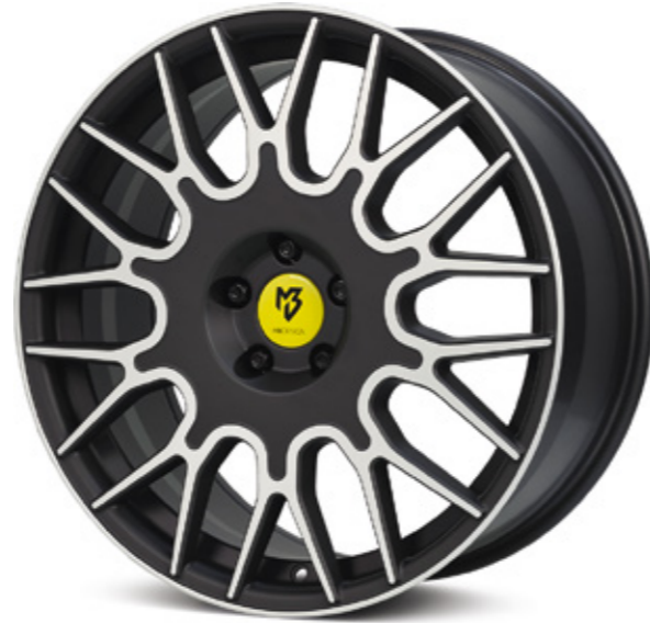
1 schwarz stumpfmatt poliert | BP2 black matt polish