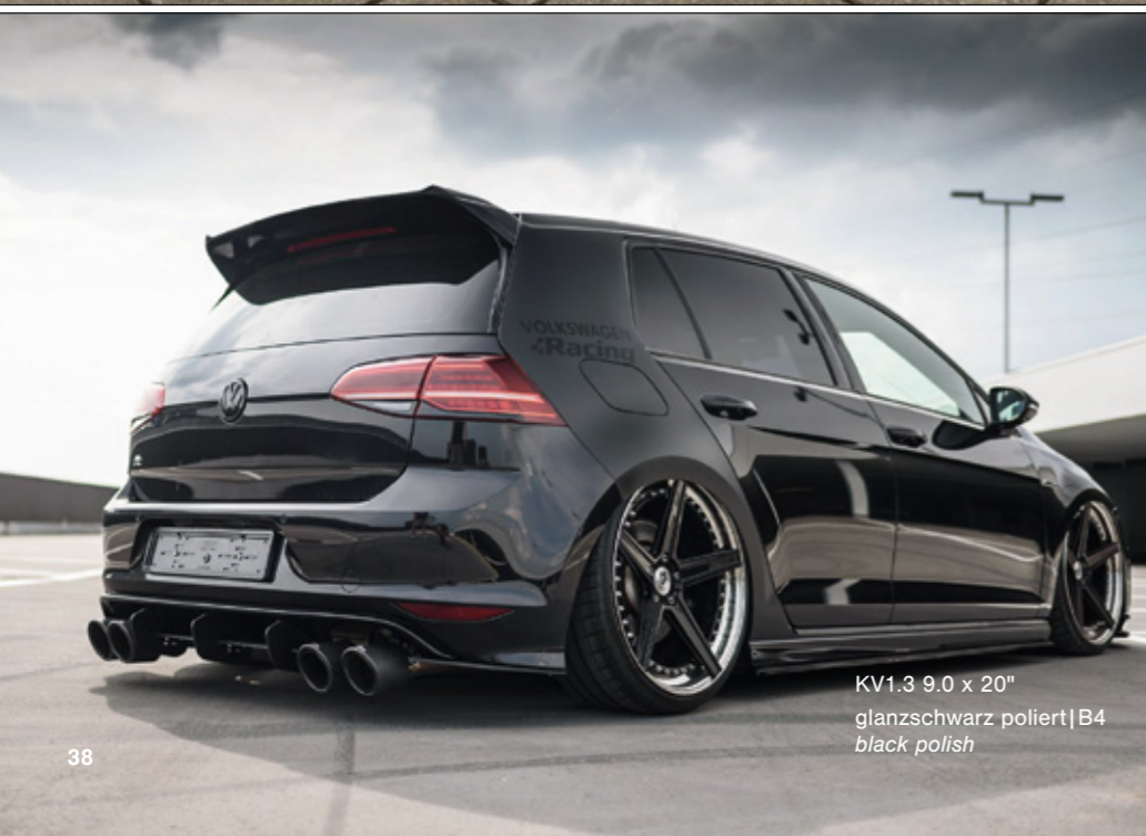
KV1.3 9.0 x 20" glanzschwarz poliert | B4 black polish