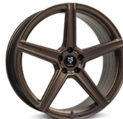
6 KV1 bronze seidenmatt | BZ1 bronze satin matt