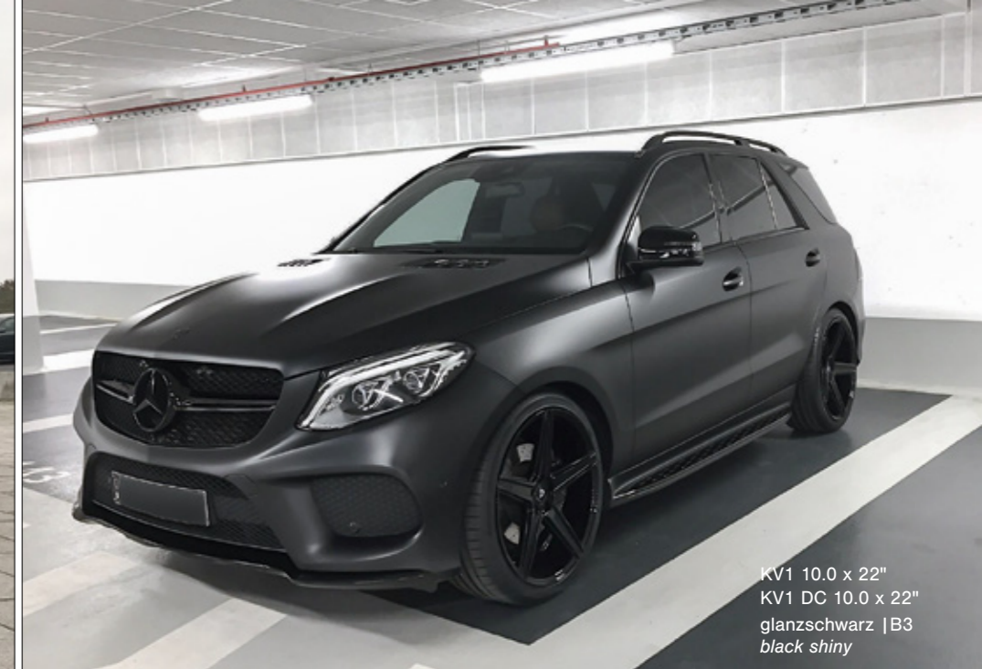
KV1 10.0 x 22" KV1 DC 10.0 x 22" glanzschwarz | B3 black shiny