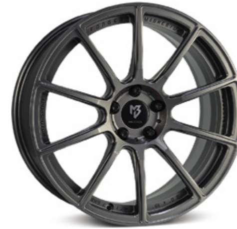
3 mattgrau | G1 grey matt