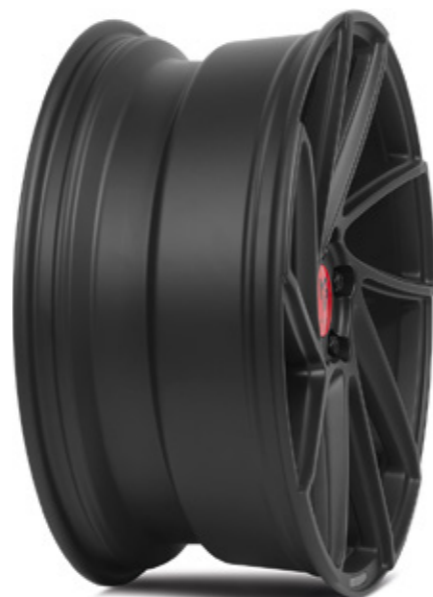
schwarz stumpfmatt | BP1 black matt