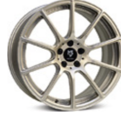
MF1 18 - 19 17" | 18" | 19" FORGED MAGNESIUM