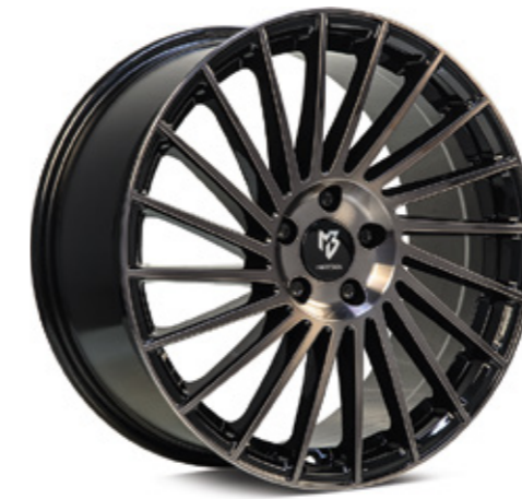
rauchschwarz glänzend poliert | BS4 black smoke shiny polish