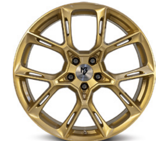
gold | GO3 gold shiny