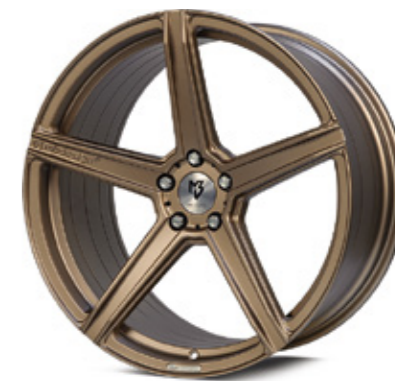
10 KV1S bronze hellmatt | BZL1 bronze light matt