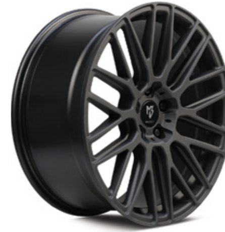
schwarz stumpfmatt | BP1 black matt