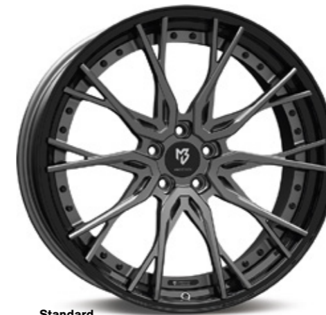
Standard Stern center: mattgrau grey matt | G1 Bett rim: glanzschwarz black shiny | B3