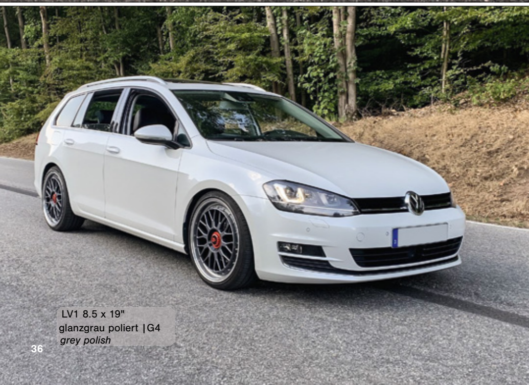
LV1 8.5 x 19" glanzgrau poliert | G4 grey polish