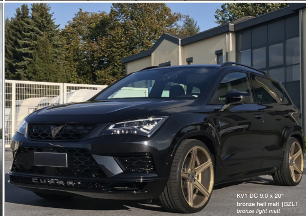
KV1 DC 9.0 x 20" bronze hell matt | BZL1 bronze light matt