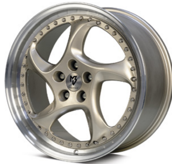
1 TURBO S champagner poliert |CH4 champagne polish