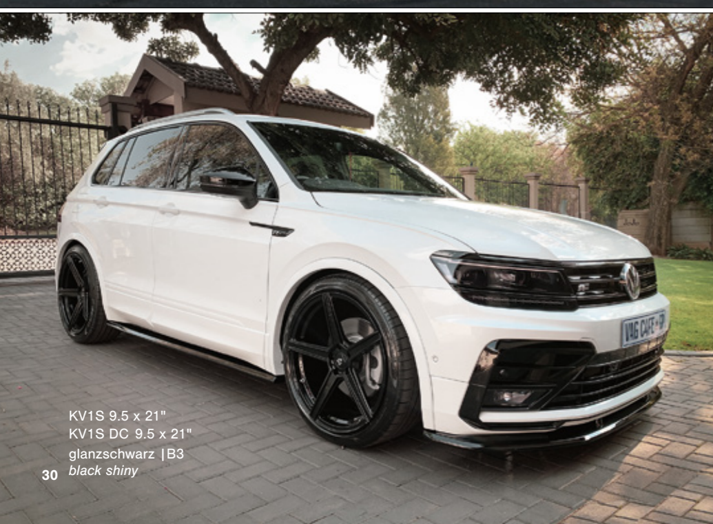
KV1S 9.5 x 21" KV1S DC 9.5 x 21" glanzschwarz | B3 black shiny