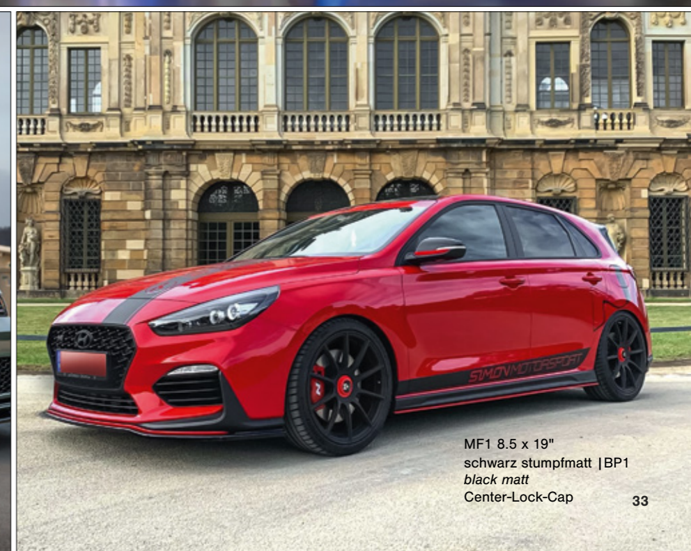
MF1 8.5 x 19" schwarz stumpfmatt | BP1 black matt Center-Lock-Cap