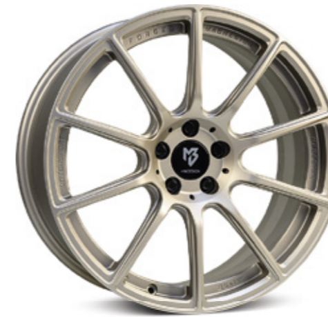
champagner matt | CH1 champagne matt