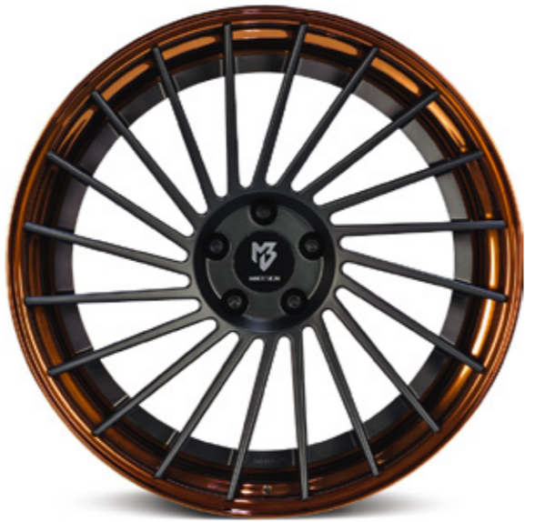
2 Aufpreis extra charge Stern center: schwarz stumpfmatt black matt | BP1 Bett rim: Sonderfarbe custom painted | CS