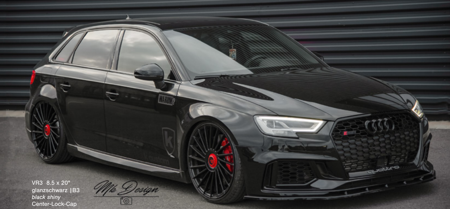
VR3 8.5 x 20" glanzschwarz | B3 black shiny Center-Lock-Cap