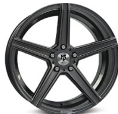
4 KV1 mattschwarz poliert | B2 black matt polish